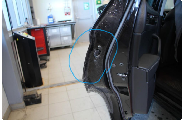
1.3 Kantbeskyttelse som kommer ut når man åpner dør mangler.