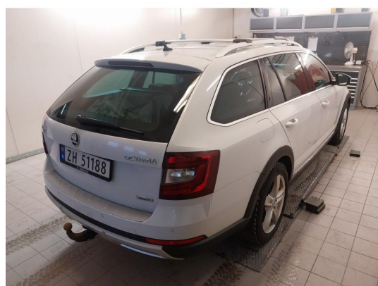
3.1 Div steinsprut og lakkriper noe mer Korrosjon