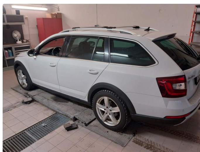
3.1 Div steinsprut og lakkriper noe mer Korrosjon