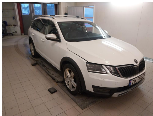
3.1 Div steinsprut og lakkriper noe mer Korrosjon