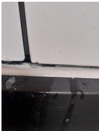
1.1 Ripe ned til grunning