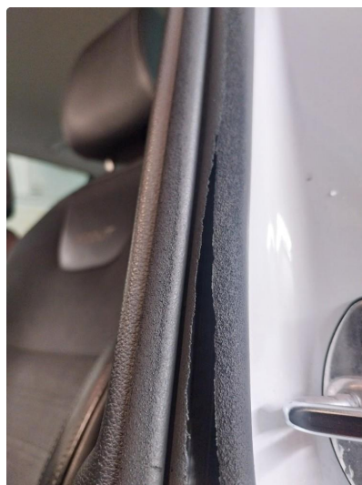
1.3 Skadet list