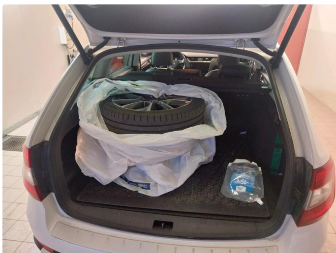
3.1 Div steinsprut og lakkriper noe mer Korrosjon