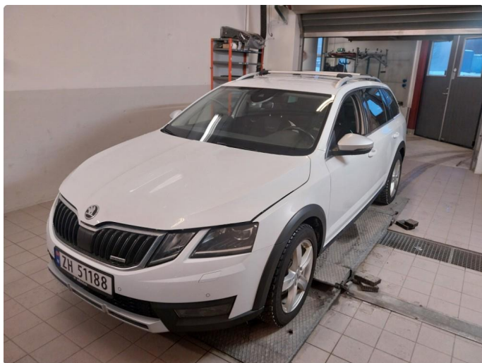
3.1 Div steinsprut og lakkriper noe mer Korrosjon