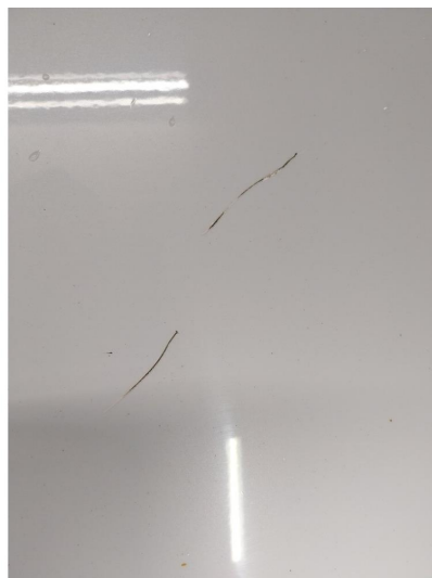
1.1 Ripe ned til grunning