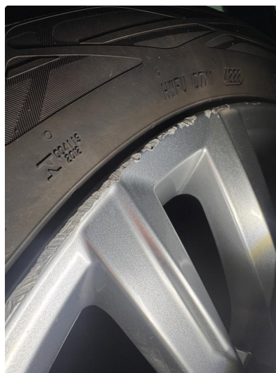
1.3 Noe kantkjørte sommerfelger.