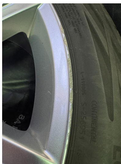
1.3 Noe kantkjørte sommerfelger.