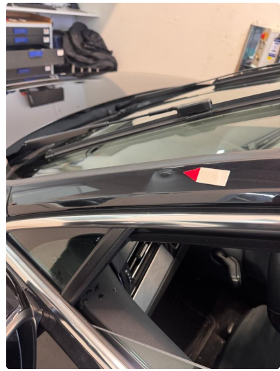
1.4 Liten bulk. Blir forsøkt med bulkfix.