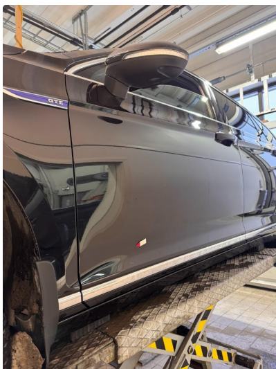
1.2 Liten steinsprut med korrosjon.