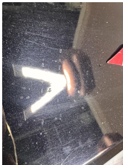
1.2 Liten steinsprut med korrosjon.