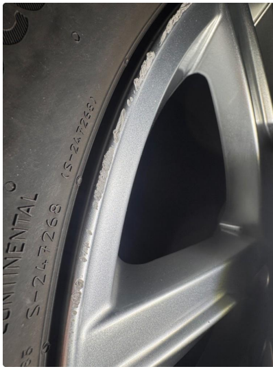
1.3 Noe kantkjørte sommerfelger.