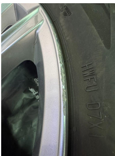
1.3 Noe kantkjørte sommerfelger.