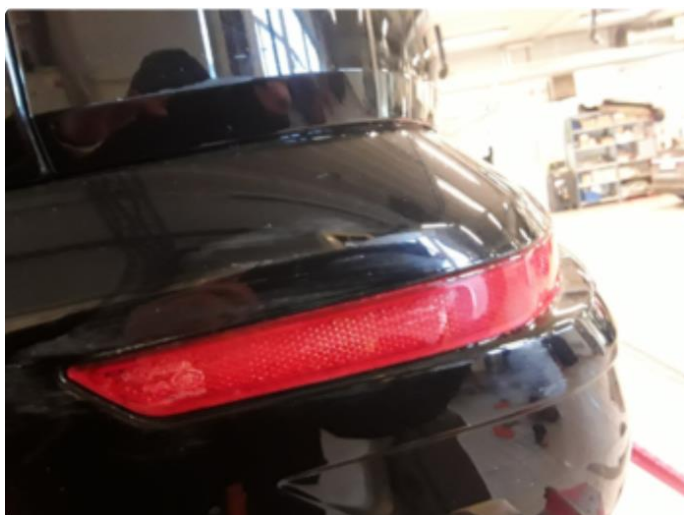
1.1 Div. lakkriper, småbulker og steinsprut med korrosjon.