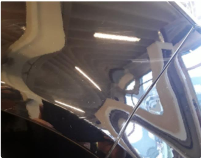
1.1 Div. lakkriper, småbulker og steinsprut med korrosjon.