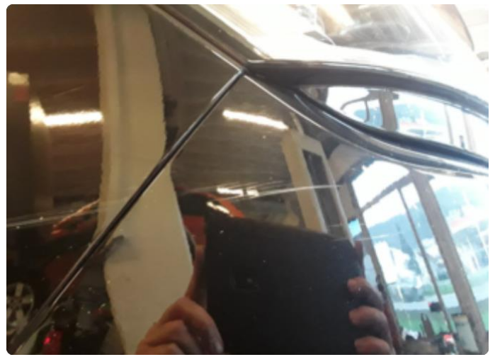
1.1 Div. lakkriper, småbulker og steinsprut med korrosjon.