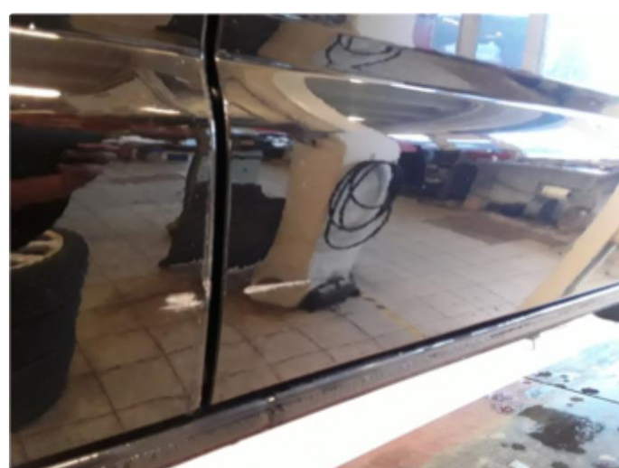
1.1 Div. lakkriper, småbulker og steinsprut med korrosjon.