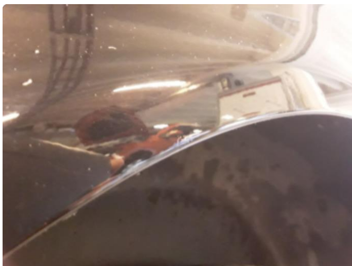
1.1 Div. lakkriper, småbulker og steinsprut med korrosjon.