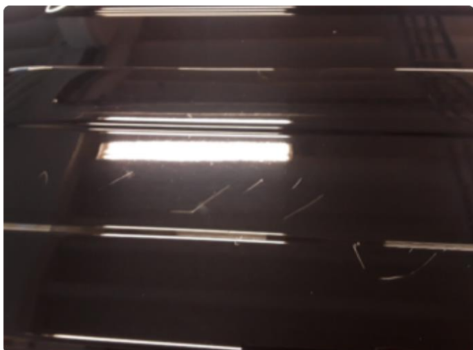
1.1 Div. lakkriper, småbulker og steinsprut med korrosjon.