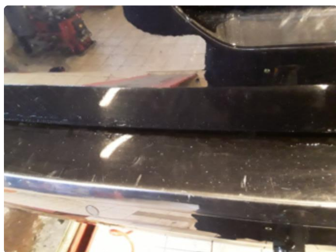
1.1 Div. lakkriper, småbulker og steinsprut med korrosjon.