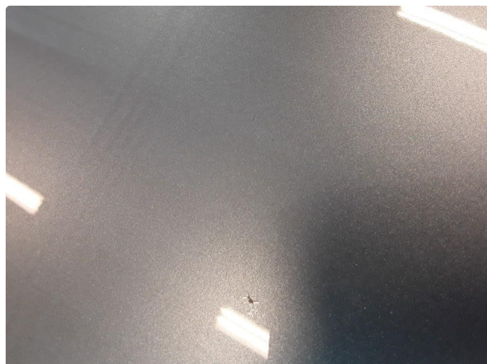
1.2 Steinsprut med rust