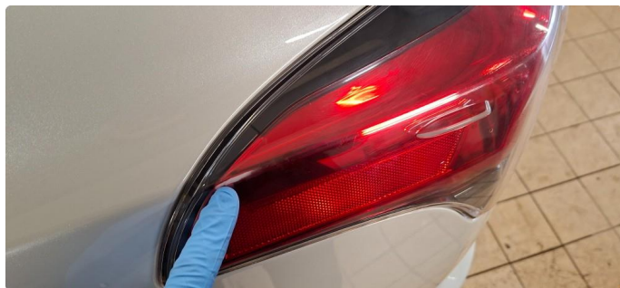
2.1 Krakelering i plast