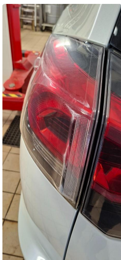
2.1 Krakelering i plast