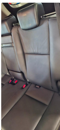
3.1 Hodestøtte skadet