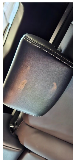
3.1 Hodestøtte skadet