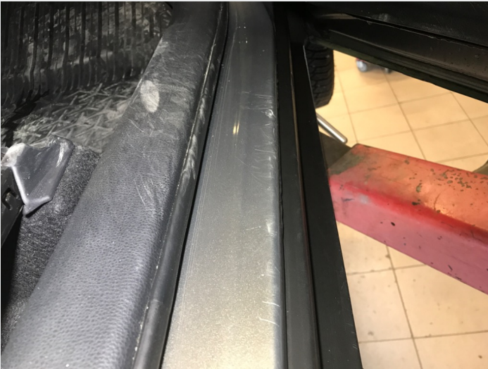
2.1 Skrammer/hakk/steinsprut/slitt lakk. (Rubbes/flikkes)