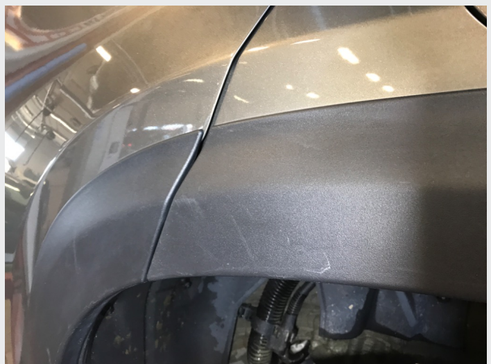
2.1 Skrammer/hakk/steinsprut/slitt lakk. (Rubbes/flikkes)