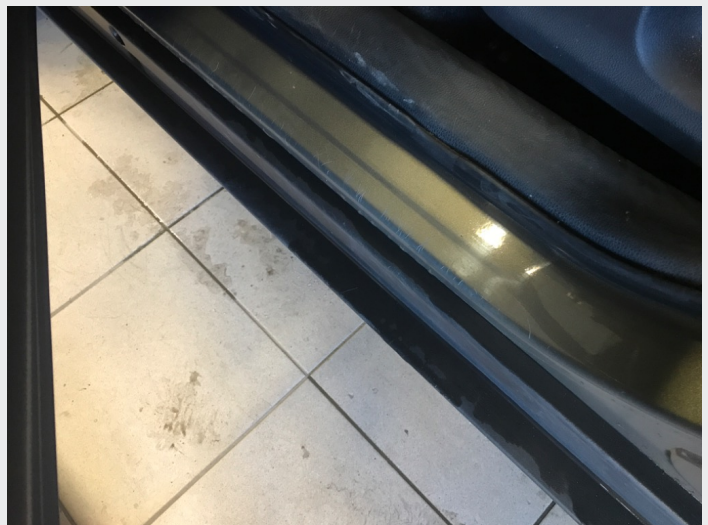
2.1 Skrammer/hakk/steinsprut/slitt lakk. (Rubbes/flikkes)