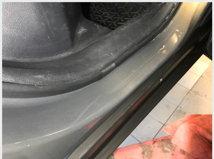
2.1 Skrammer/hakk/steinsprut/slitt lakk. (Rubbes/flikkes)