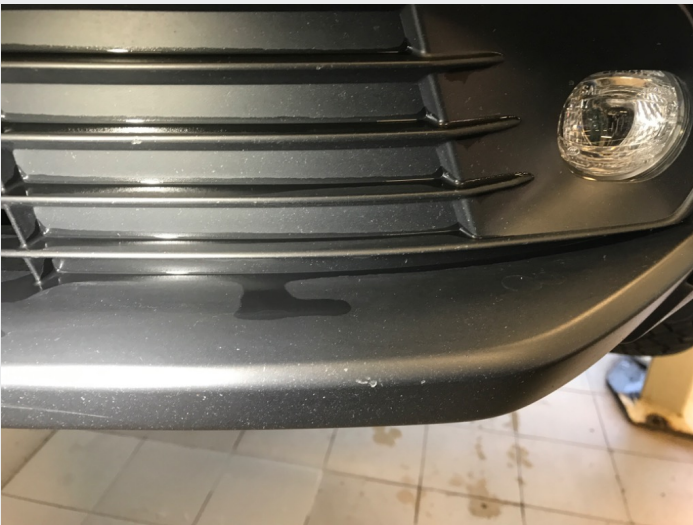
2.1 Skrammer/hakk/steinsprut/slitt lakk. (Rubbes/flikkes)