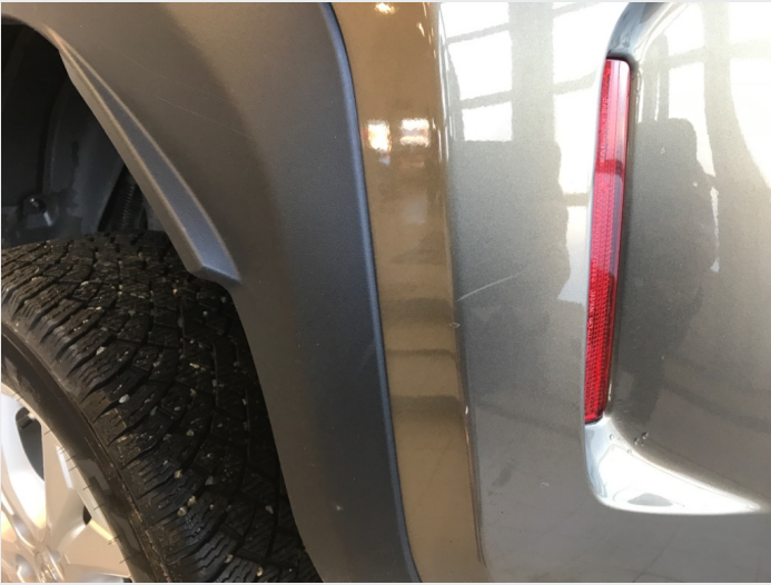
2.1 Skrammer/hakk/steinsprut/slitt lakk. (Rubbes/flikkes)