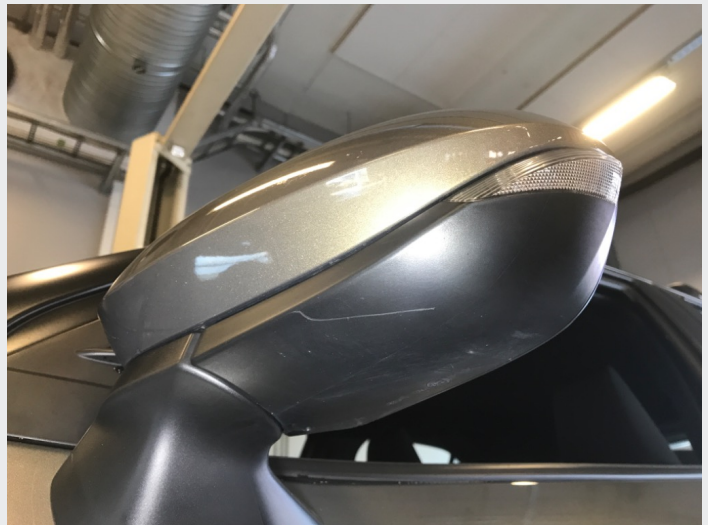
2.1 Skrammer/hakk/steinsprut/slitt lakk. (Rubbes/flikkes)