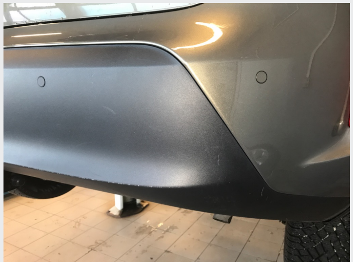
2.1 Skrammer/hakk/steinsprut/slitt lakk. (Rubbes/flikkes)