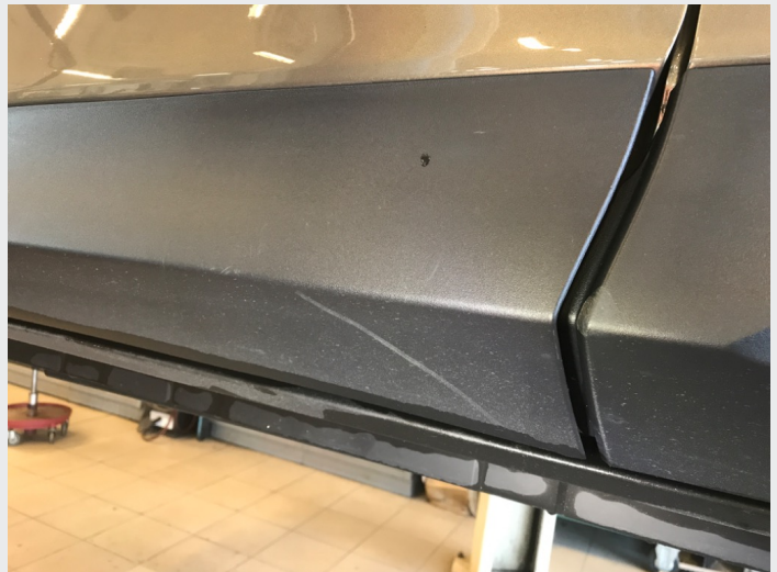
2.1 Skrammer/hakk/steinsprut/slitt lakk. (Rubbes/flikkes)