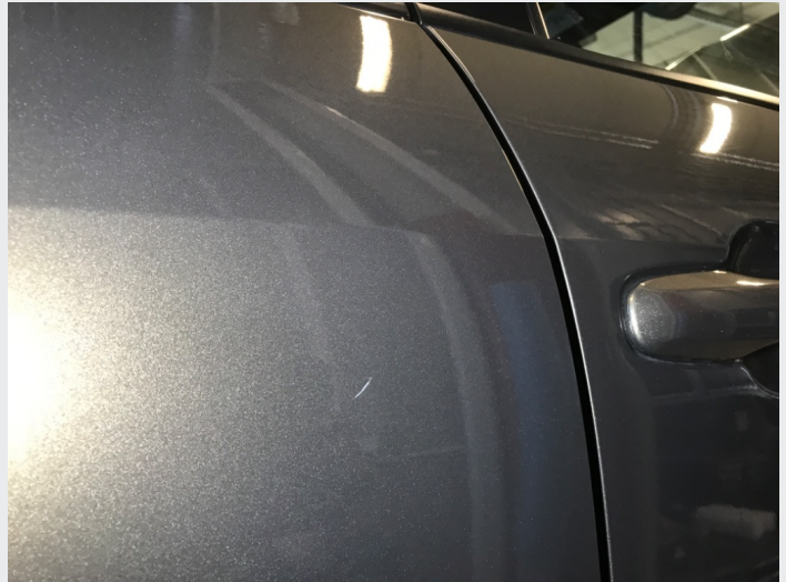
2.1 Skrammer/hakk/steinsprut/slitt lakk. (Rubbes/flikkes)