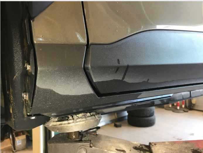
2.1 Skrammer/hakk/steinsprut/slitt lakk. (Rubbes/flikkes)