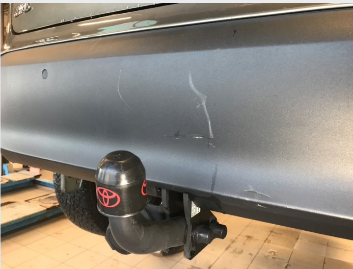
2.1 Skrammer/hakk/steinsprut/slitt lakk. (Rubbes/flikkes)