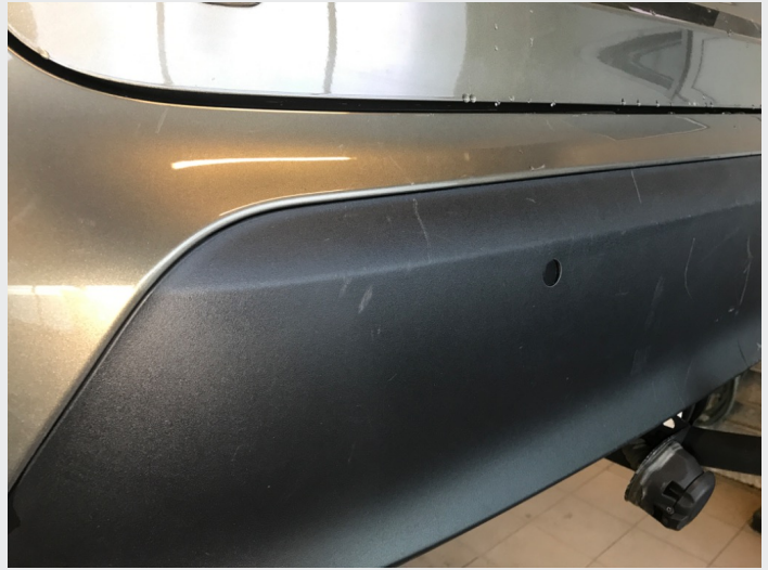
2.1 Skrammer/hakk/steinsprut/slitt lakk. (Rubbes/flikkes)