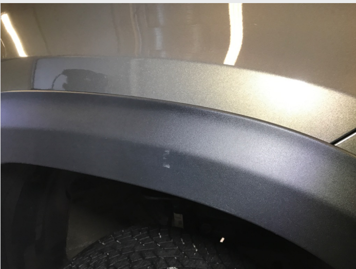
2.1 Skrammer/hakk/steinsprut/slitt lakk. (Rubbes/flikkes)