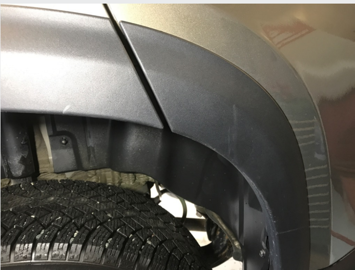
2.1 Skrammer/hakk/steinsprut/slitt lakk. (Rubbes/flikkes)