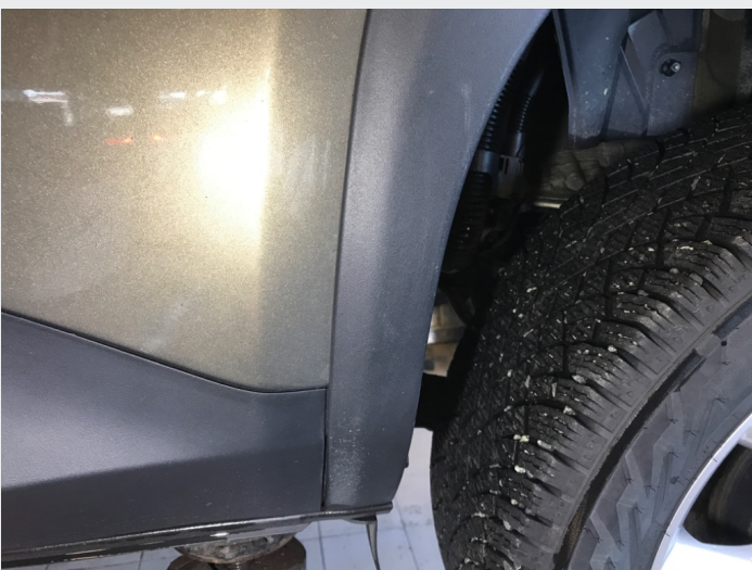
2.1 Skrammer/hakk/steinsprut/slitt lakk. (Rubbes/flikkes)