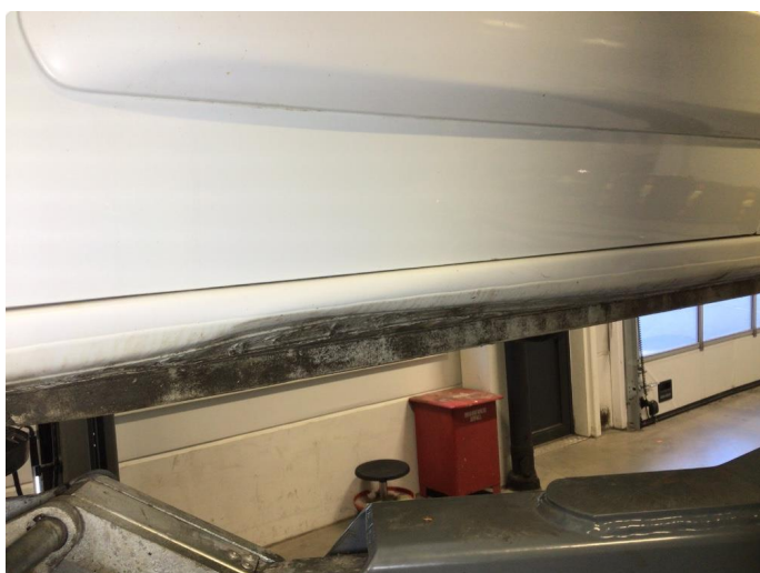
1.2 Bulk i kanal venstre side