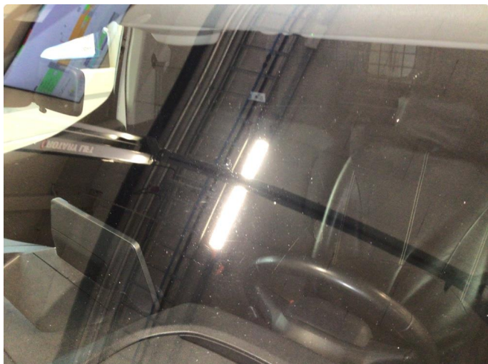
1.1 Noe steinsprut på frontvindu, en knast blir limt