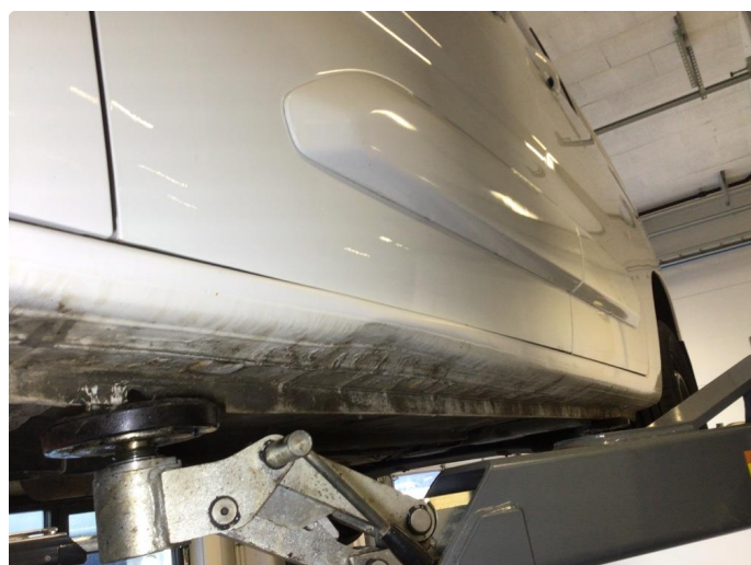
1.2 Bulk i kanal venstre side