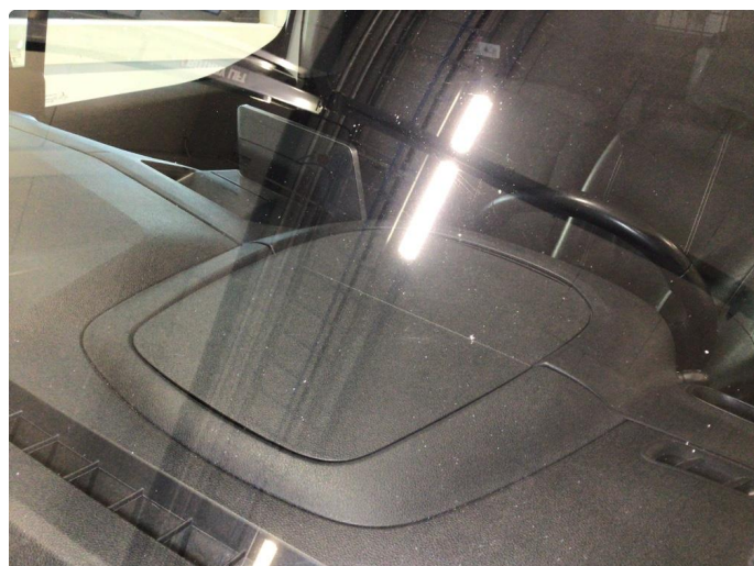
1.1 Noe steinsprut på frontvindu, en knast blir limt