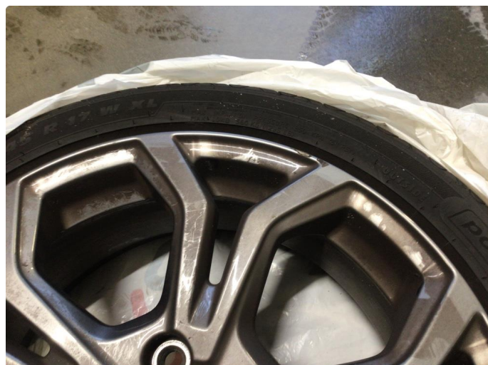
1.1 Kantkjørt to vinterfelger og to sommerfelger