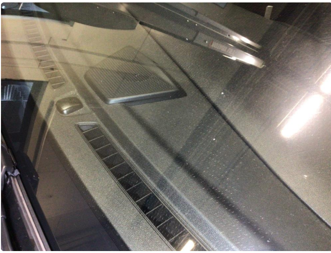
1.2 Noe slitasjeriper og steinsprut på frontvindu