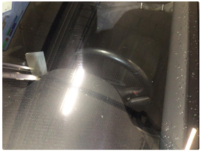
1.2 Noe slitasjeriper og steinsprut på frontvindu