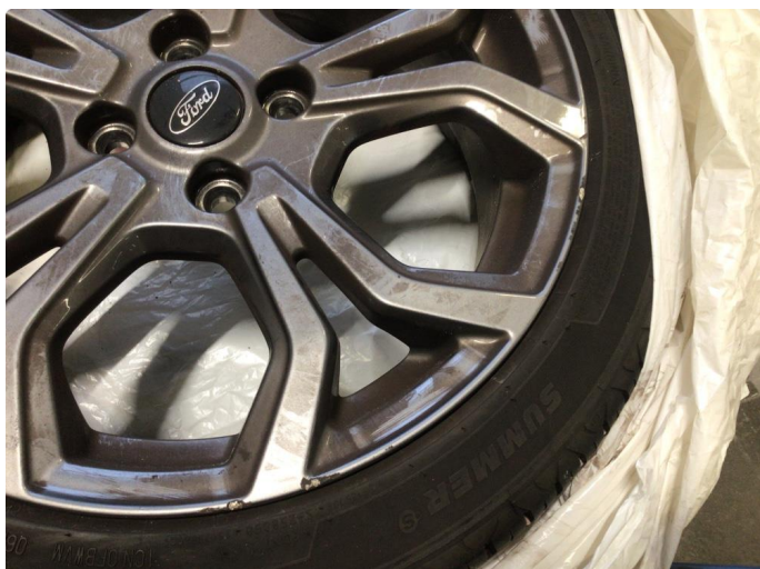
1.1 Kantkjørt to vinterfelger og to sommerfelger