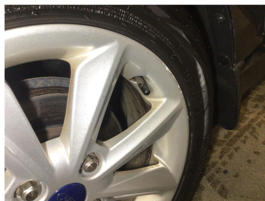
1.1 Kantkjørt to vinterfelger og to sommerfelger