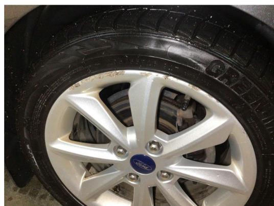
1.1 Kantkjørt to vinterfelger og to sommerfelger