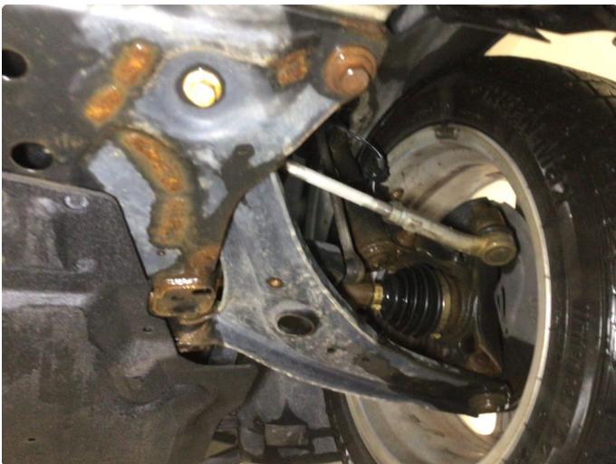
2.1 Overflaterust i forstilling, ingen tiltak kreves