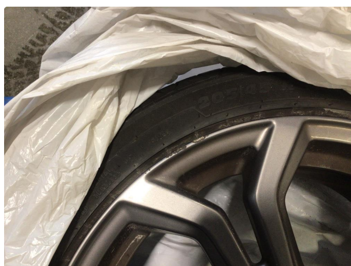
1.1 Kantkjørt to vinterfelger og to sommerfelger