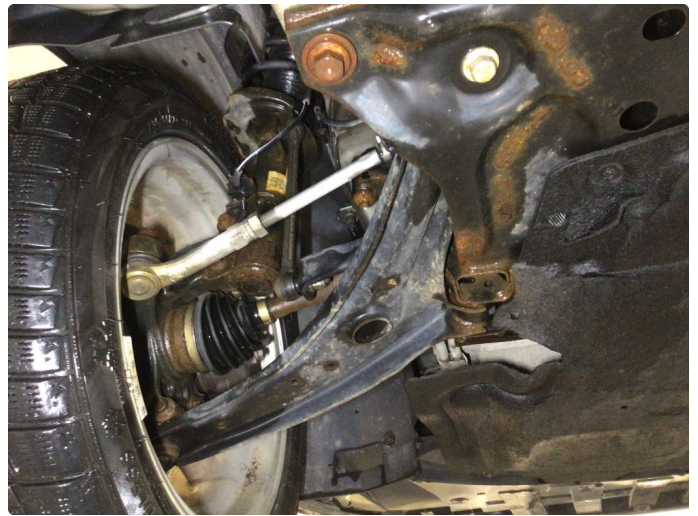
2.1 Overflaterust i forstilling, ingen tiltak kreves