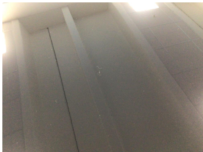
1.1 Noe steinsprut på panser