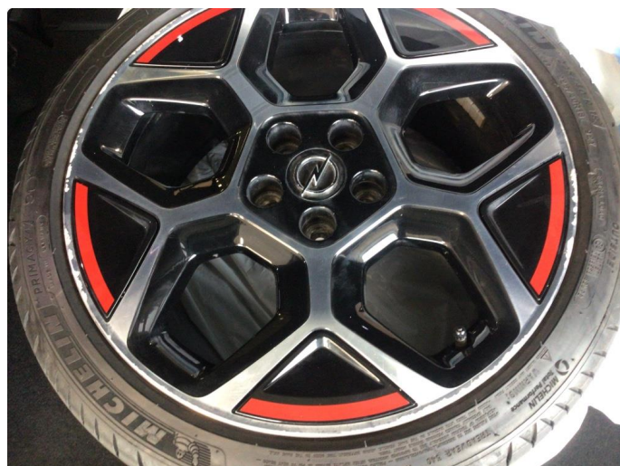
1.2 Kantkjørt en vinterfelg og en sommerfelg