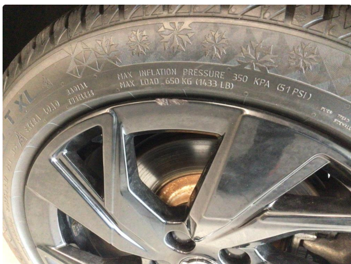
1.2 Kantkjørt en vinterfelg og en sommerfelg