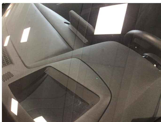
1.4 Noe steinsprut på frontvindu