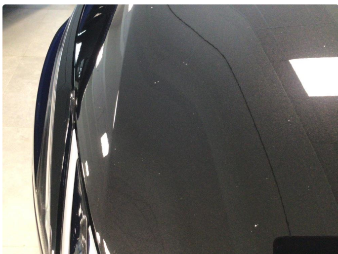
1.1 Steinsprut på panser