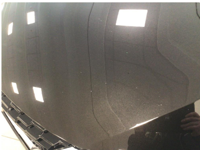
1.1 Steinsprut på panser