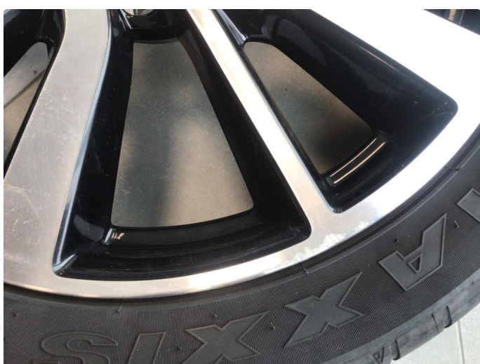
1.3 Kantkjørt en sommerfelg