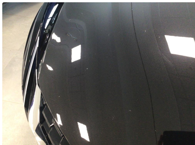
1.1 Steinsprut på panser