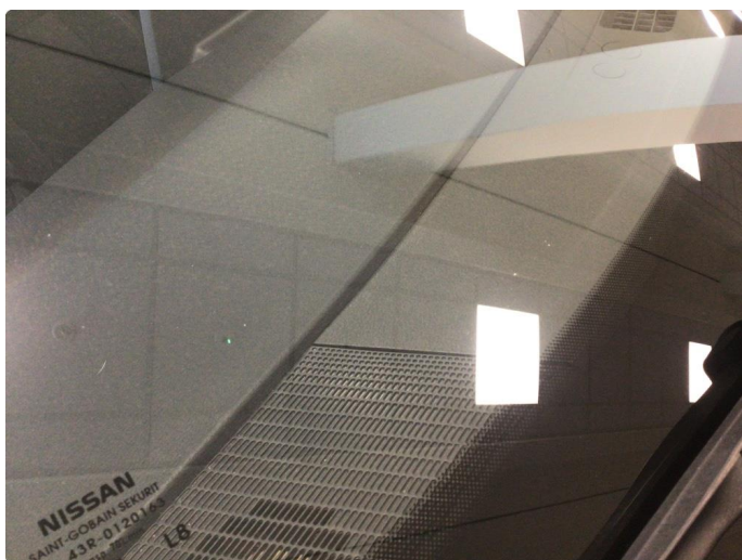
1.4 Noe steinsprut på frontvindu