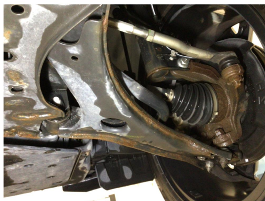
2.1 Overflaterust i forstilling, ingen tiltak kreves