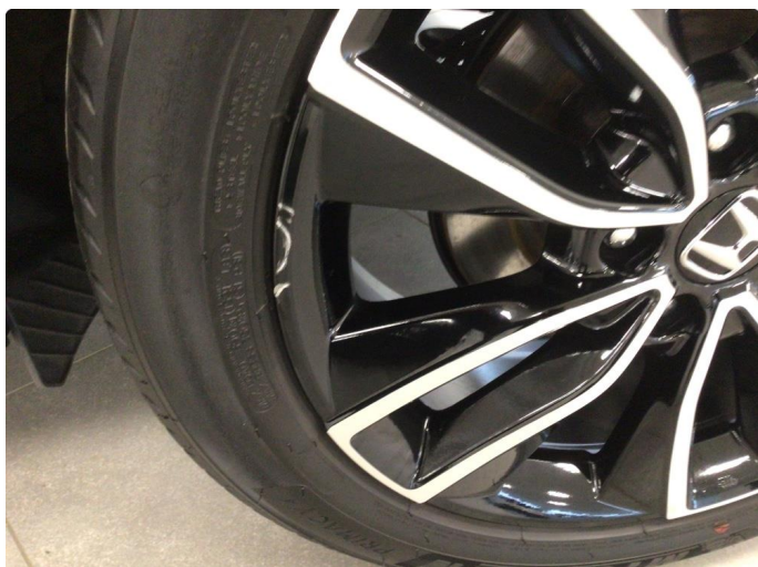
1.1 Kantkjørt en sommerfelg