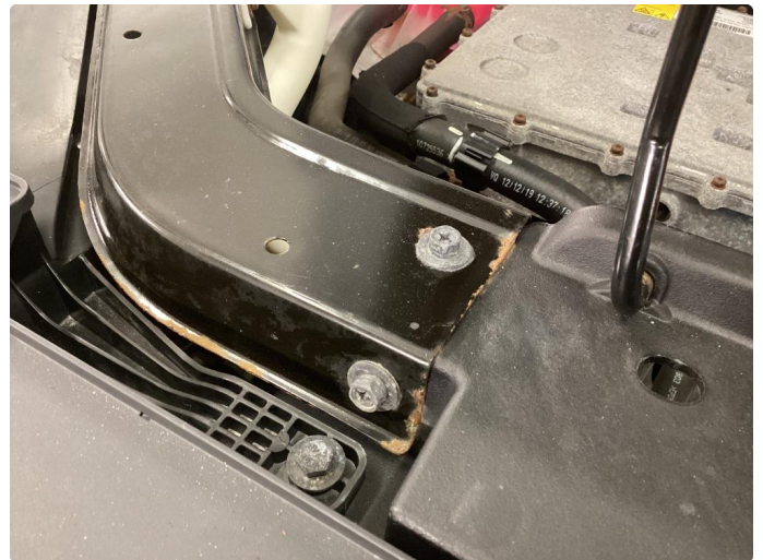
1.1 Noe korrosjon/rust