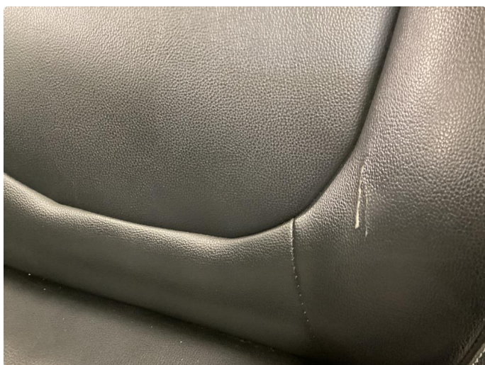
2.1 Skade på setepute