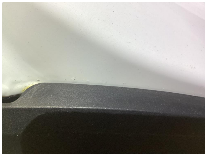
1.3 Noen bulker med lakkskader