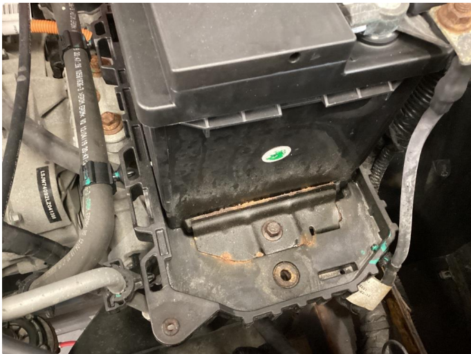
1.2 Noe korrosjon/rust