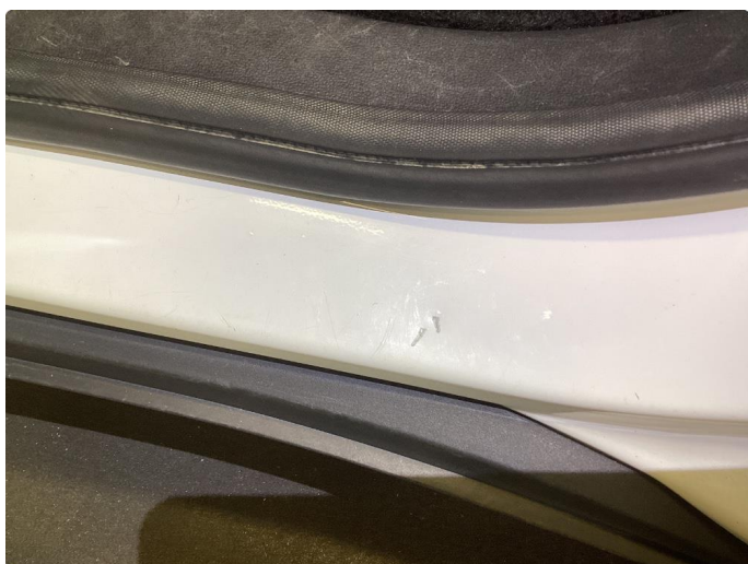
1.3 Noen bulker med lakkskader