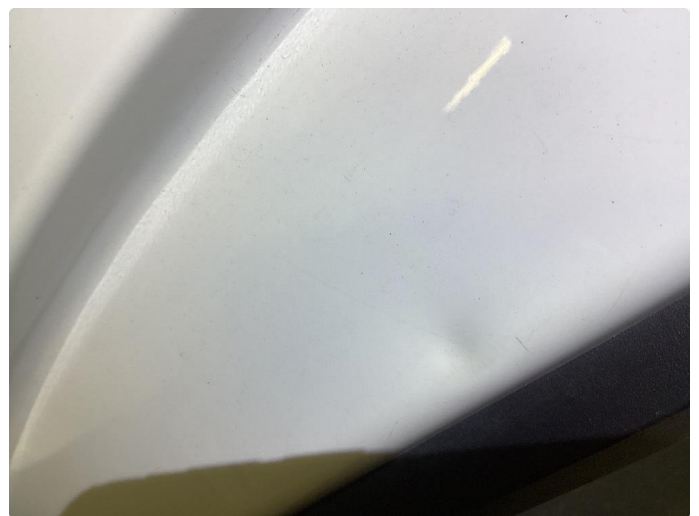
1.3 Noen bulker med lakkskader