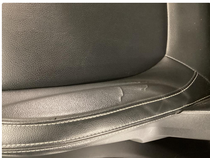
2.1 Skade på setepute