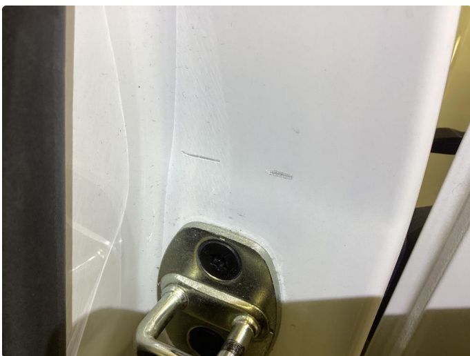
1.3 Noen bulker med lakkskader