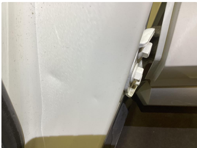
1.3 Noen bulker med lakkskader