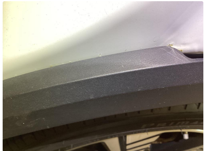
1.3 Noen bulker med lakkskader