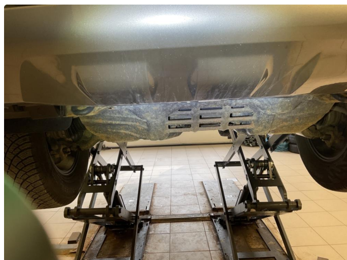
1.1 Skadet/slitt kan trenge oljebehandling