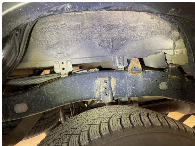
1.1 Skadet/slitt kan trenge oljebehandling