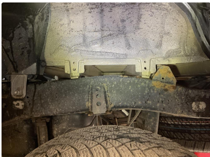
1.1 Skadet/slitt kan trenge oljebehandling