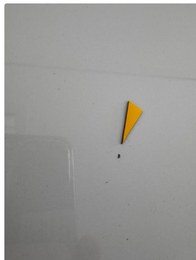
1.2 Noen små steinsprut med korrosjon.