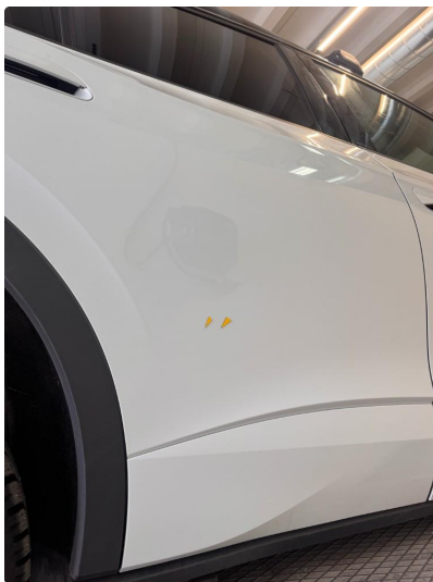
1.2 Noen små steinsprut med korrosjon.