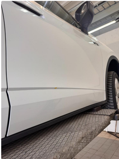
1.2 Noen små steinsprut med korrosjon.