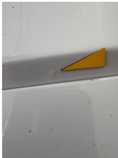
1.2 Noen små steinsprut med korrosjon.