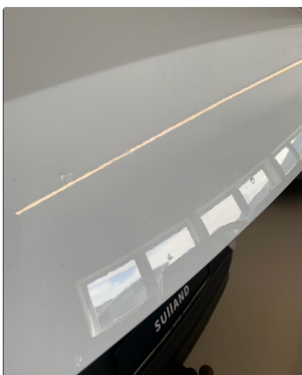
1.3 Noe steinsprut med korrosjon.