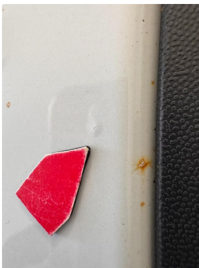
1.4 Liten steinsprut med korrosjon høyre foran.