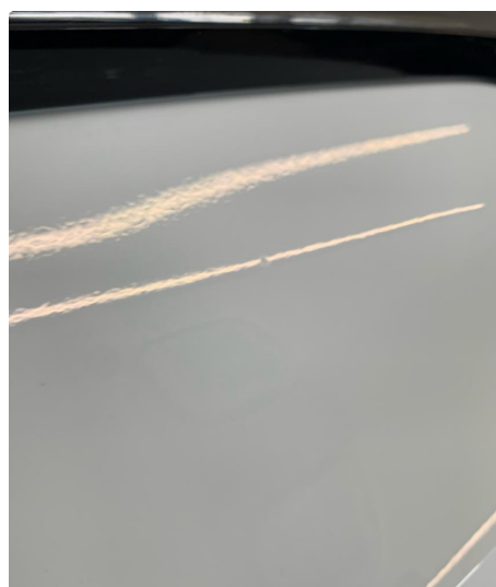
1.3 Noe steinsprut med korrosjon.