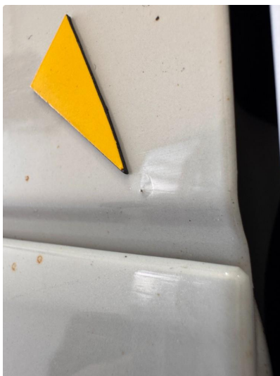
1.2 Noen små steinsprut med korrosjon.