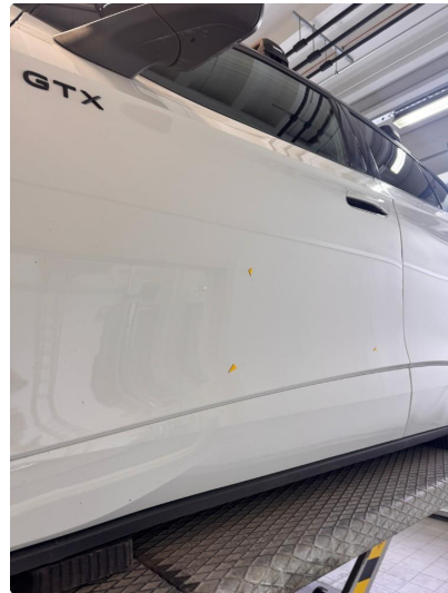
1.2 Noen små steinsprut med korrosjon.