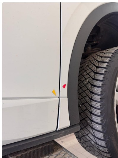
1.4 Liten steinsprut med korrosjon høyre foran.