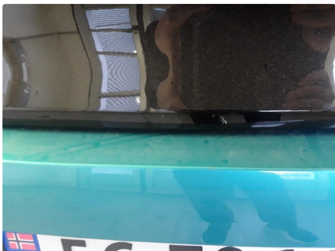
1.1 Ripe/hakk nederst bakluke