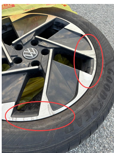
1.1 3 felger sommer noen lakksår