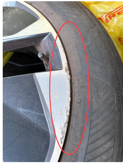
1.1 3 felger sommer noen lakksår