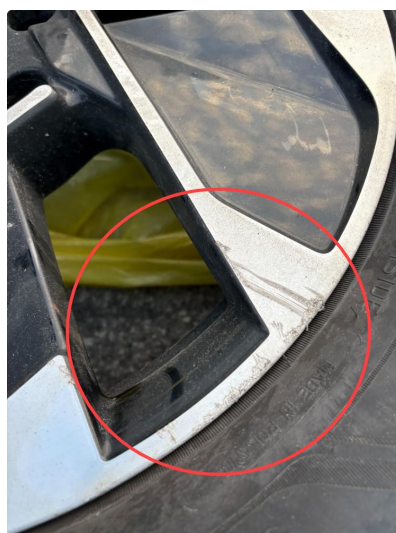
1.1 3 felger sommer noen lakksår