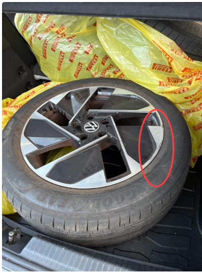
1.1 3 felger sommer noen lakksår