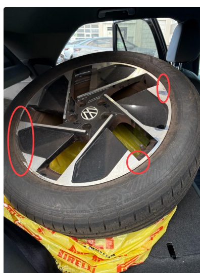
1.1 3 felger sommer noen lakksår