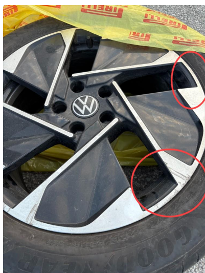
1.1 3 felger sommer noen lakksår