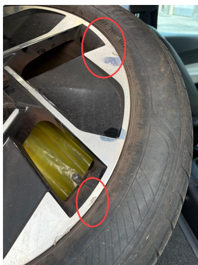
1.1 3 felger sommer noen lakksår