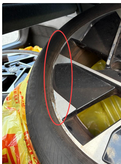
1.1 3 felger sommer noen lakksår