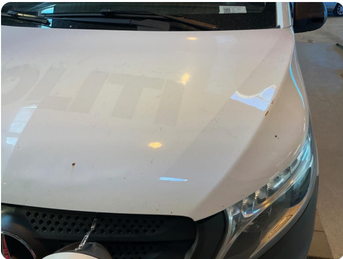
1.2 Noe steinsprut med rust