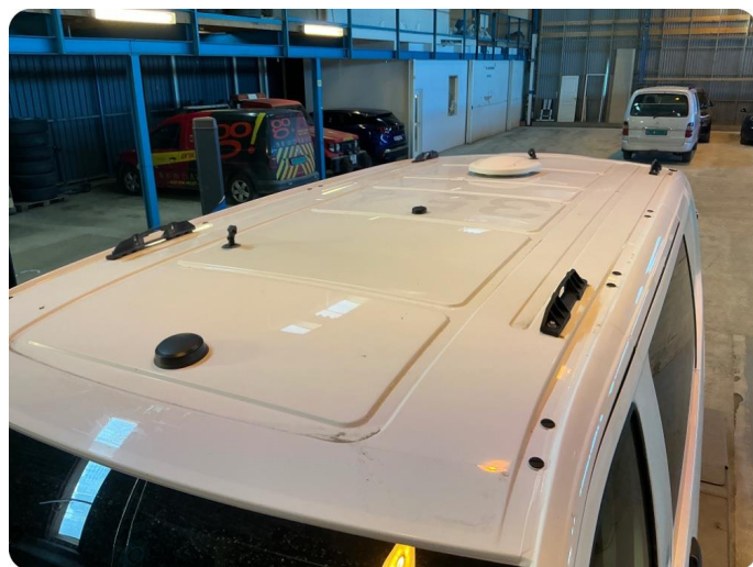
1.8 Øvrige feil Rester etter utstyr.