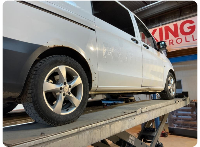
1.1 Noe korrosjon/rust Rust på hjulbuer, skyvedør, kanal begge sider. Samt rust/ lakk flass på hengsler bakluke.