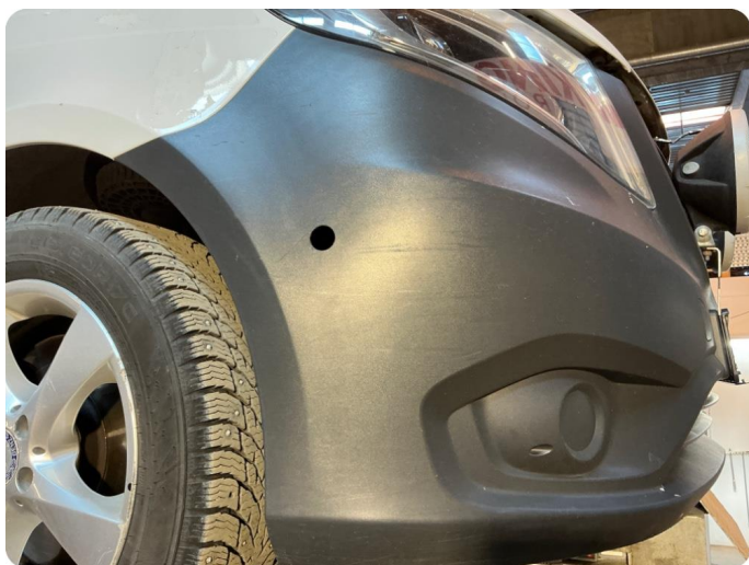
1.7 Øvrige feil Hull etter utstyr/lys. Samt skrubbsår i underkant av støtfanger.