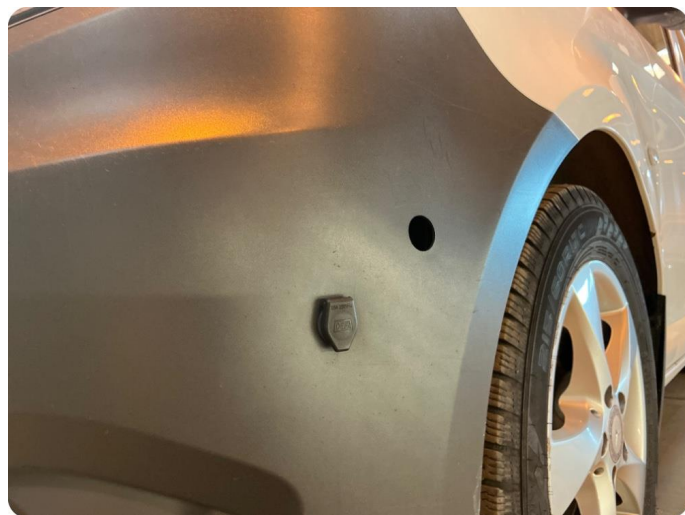
1.7 Øvrige feil Hull etter utstyr/lys. Samt skrubbsår i underkant av støtfanger.