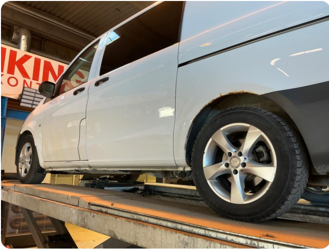
1.1 Noe korrosjon/rust Rust på hjulbuer, skyvedør, kanal begge sider. Samt rust/ lakk flass på hengsler bakluke.