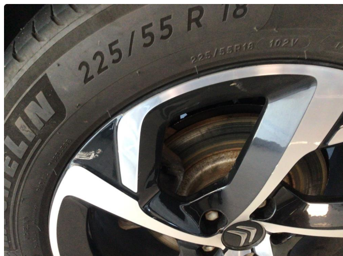
1.1 Kantkjørt to sommerfelger og en vinterfelg