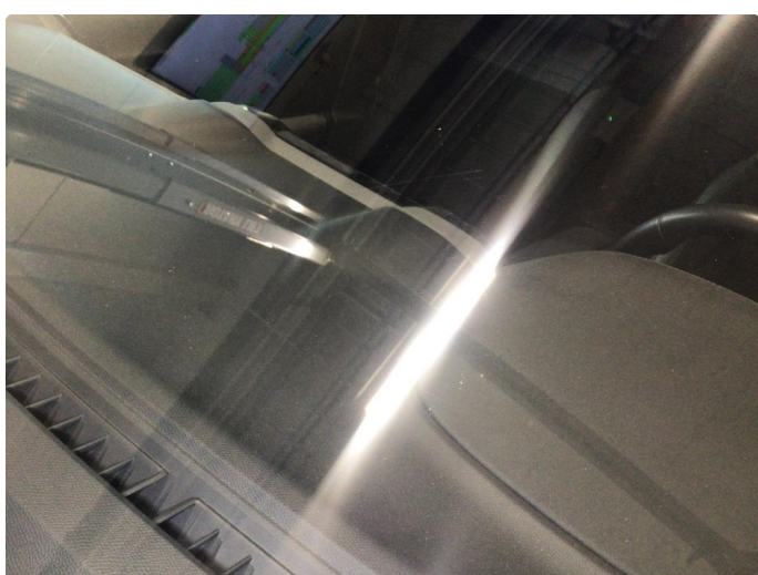
1.2 Noe steinsprut på frontvindu