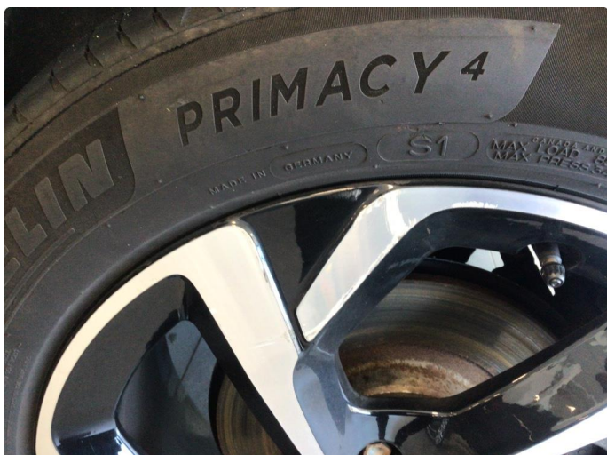
1.1 Kantkjørt to sommerfelger og en vinterfelg