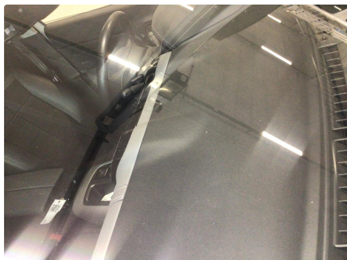
1.2 Noe steinsprut på frontvindu