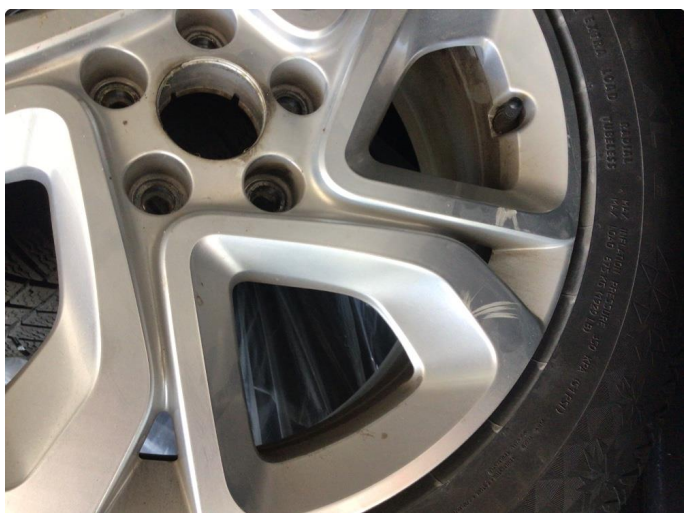
1.1 Kantkjørt to sommerfelger og en vinterfelg