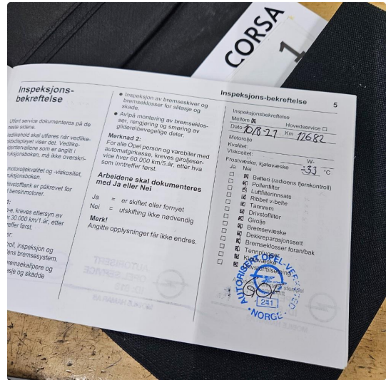
2.1 Dokumentert service, se bilde