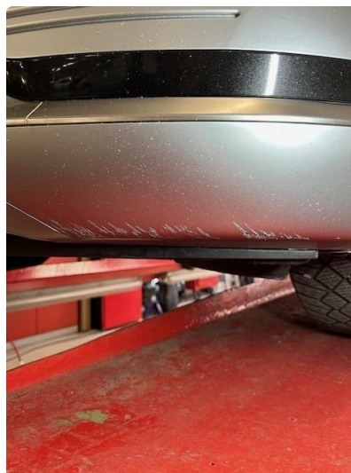
1.2 Riper underkant