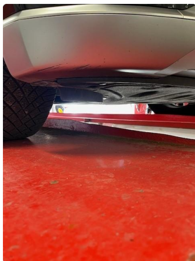
1.2 Riper underkant