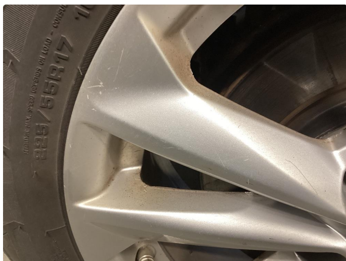
1.4 Skade på felg