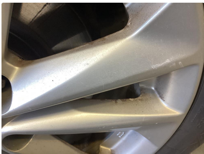
1.4 Skade på felg