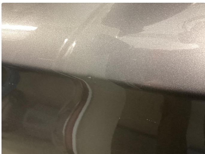
1.1 Noen bulker