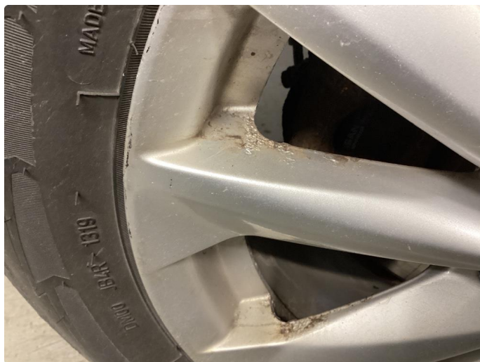
1.4 Skade på felg