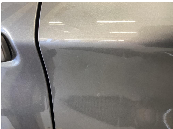
1.1 Noen bulker