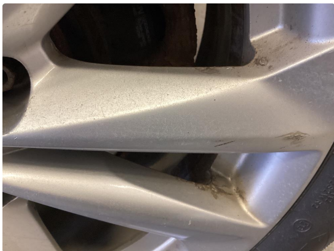
1.4 Skade på felg