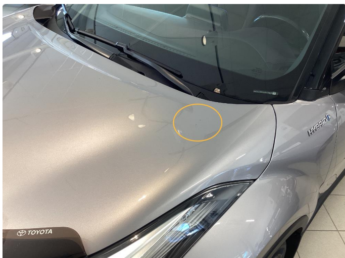
1.1 Div steinsprut panser