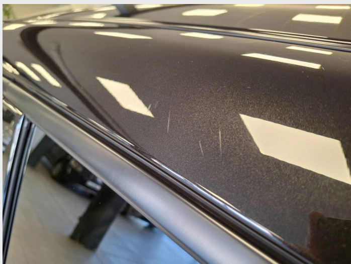
2.10 Små riper over dør v.s.b