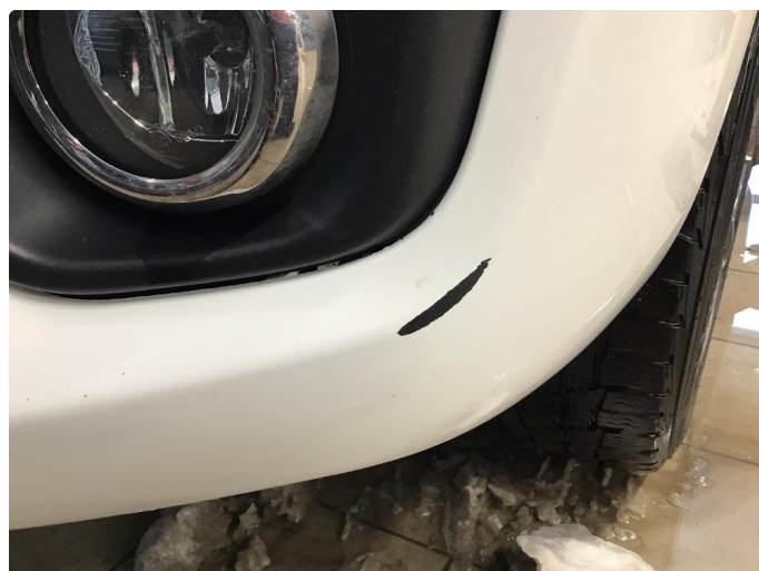
1.3 Lakk flasser