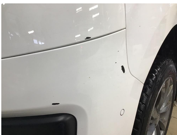
1.3 Lakk flasser