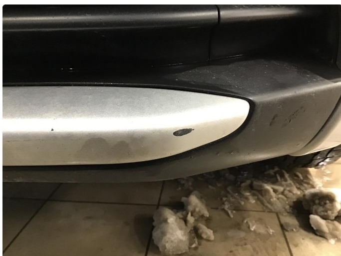
1.3 Lakk flasser