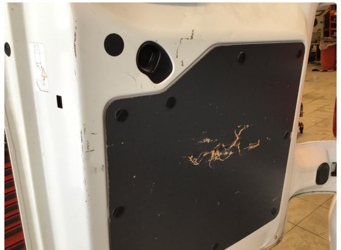
2.1 Skadet/merker etter utstyr