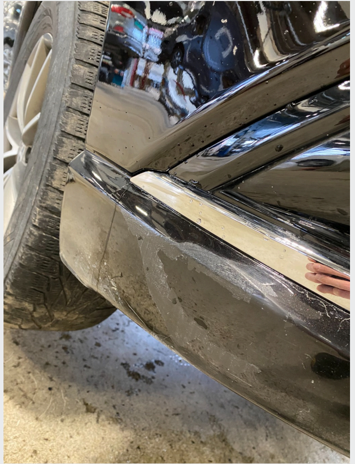
2.8 Høyre fram. Skade.