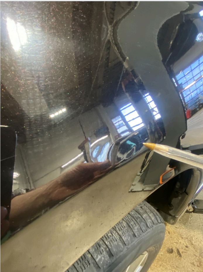
2.7 V.F Bulk