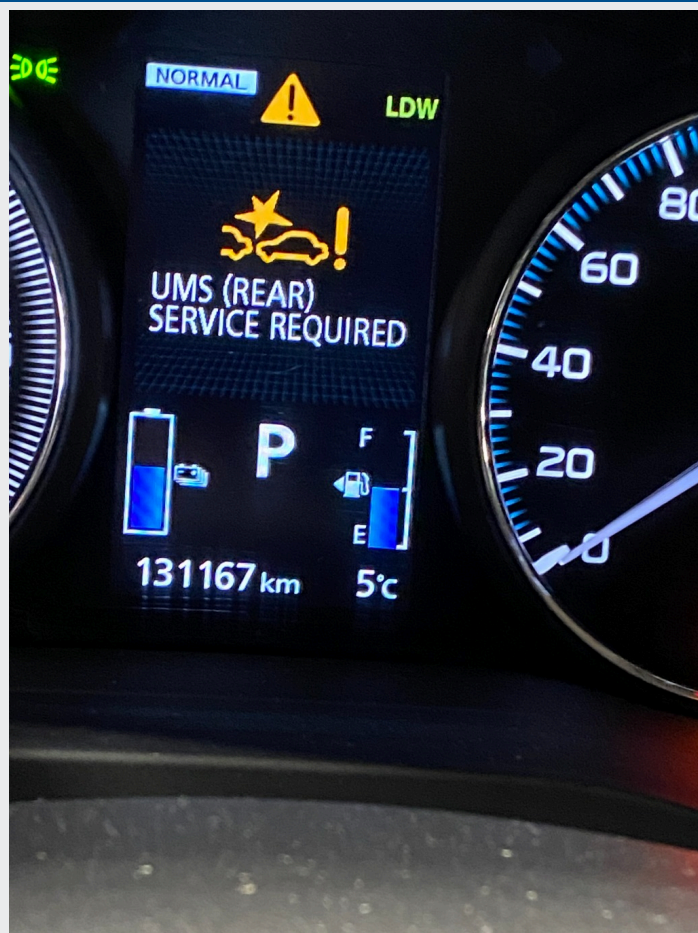
2.9 Feilmelding på sensor bak.