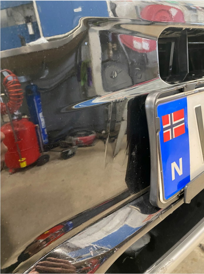
2.8 Høyre fram. Skade.