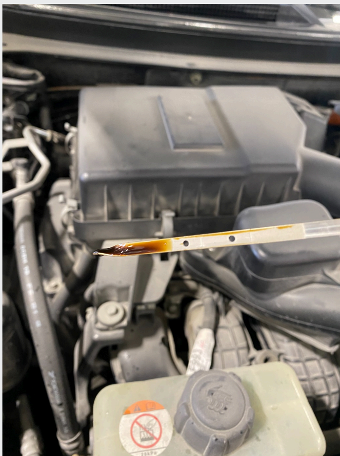
5.11 Siste service i 2024. Ved 102771km.