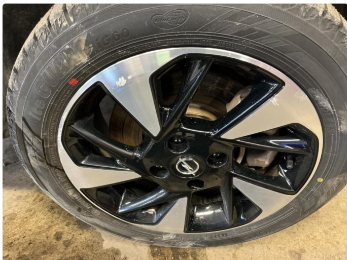
1.3 Skade på felg