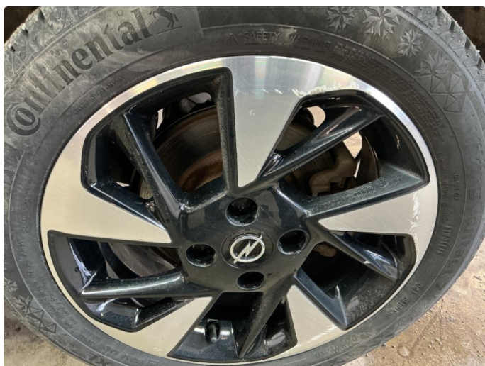
1.3 Skade på felg