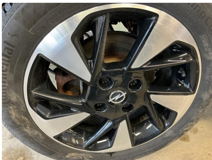
1.3 Skade på felg