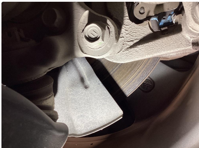
1.1 Rust. KJØRES RENE NÅR BILEN TAS I BRUK.