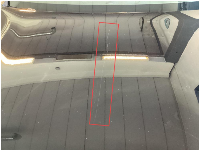
1.1 Ripe på panser