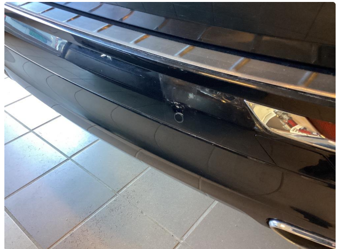
1.4 Tidligere p.skade reparert punktvis med lakk.