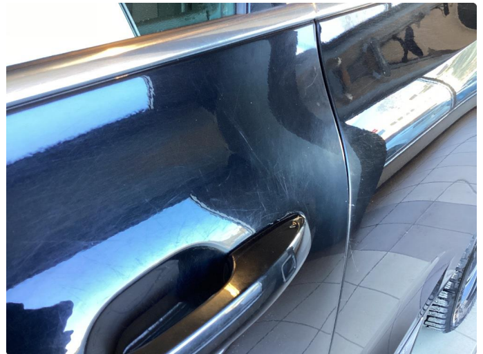
1.2 Slitt lakk ved døråpning, førerdør