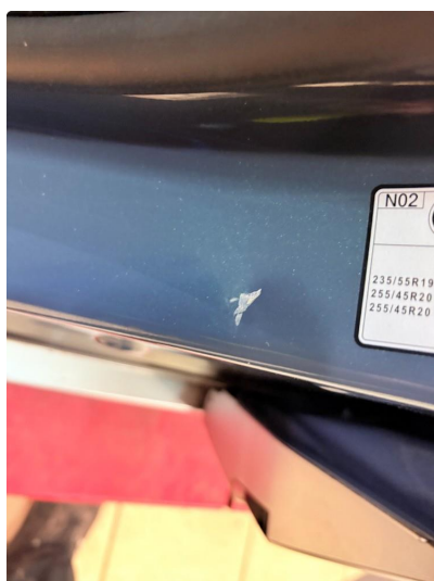
1.3 Bulk(er) med lakkskade