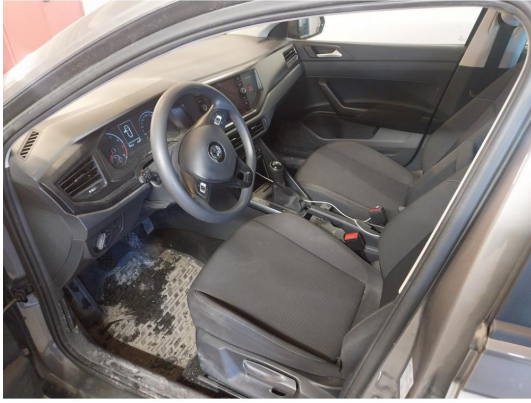
2.1 Div steinsprut og lakkriper finnes.