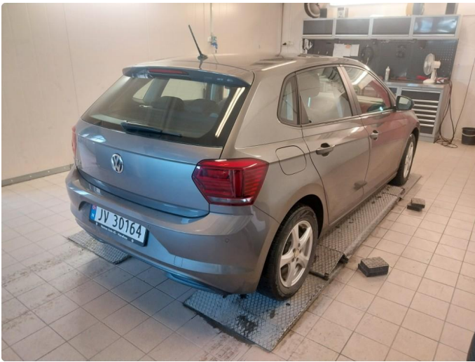
2.1 Div steinsprut og lakkriper finnes.