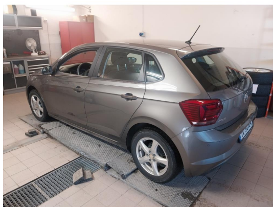
2.1 Div steinsprut og lakkriper finnes.