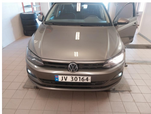
2.1 Div steinsprut og lakkriper finnes.