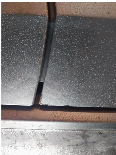
1.1 Steinsprut med korosjon