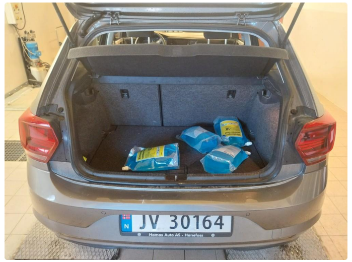
2.1 Div steinsprut og lakkriper finnes.