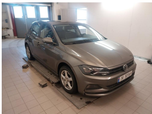
2.1 Div steinsprut og lakkriper finnes.