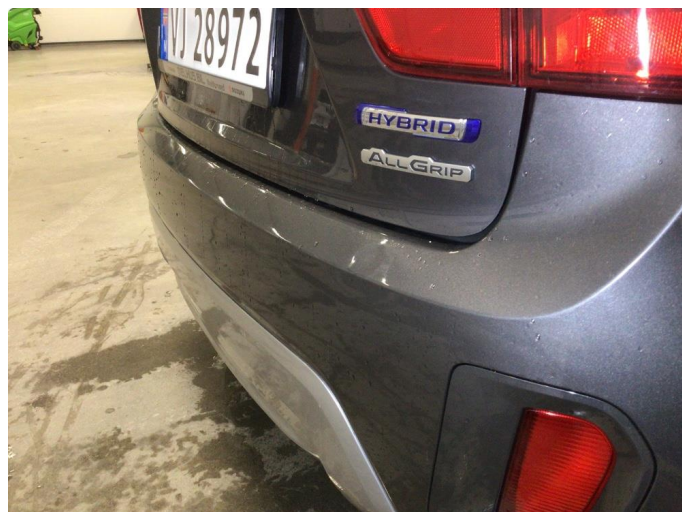
1.1 Liten bulk ved innlastingszone på bakfanger, dette blir å anse som normal bruksslitasje