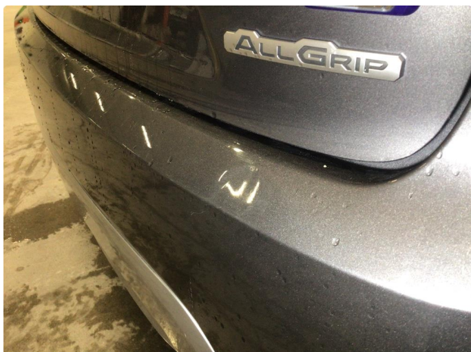
1.1 Liten bulk ved innlastingszone på bakfanger, dette blir å anse som normal bruksslitasje