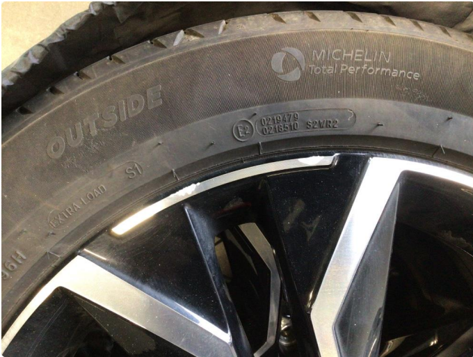
1.1 Kantkjørt en sommerfelg