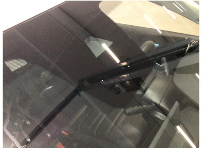
1.2 Noe steinsprut på frontvindu