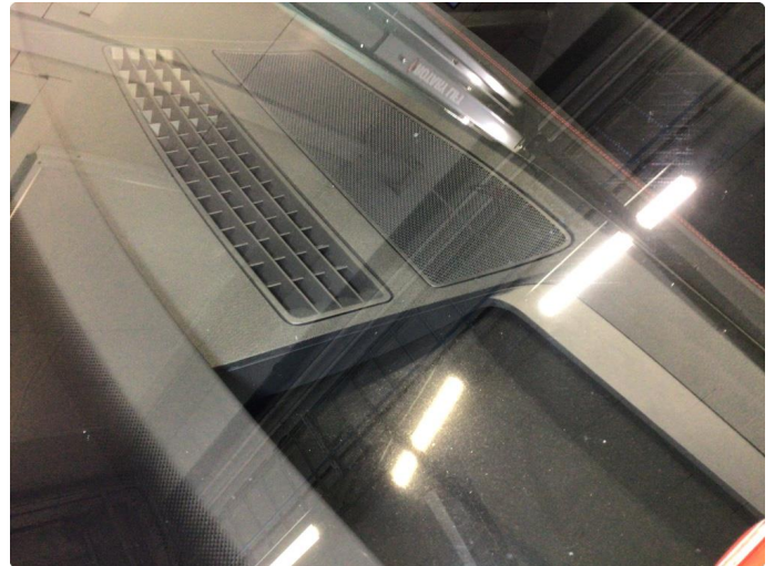
1.1 Noe steinsprut på frontvindu