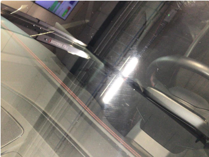
1.1 Noe steinsprut på frontvindu