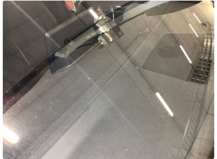
1.1 Noe steinsprut på frontvindu