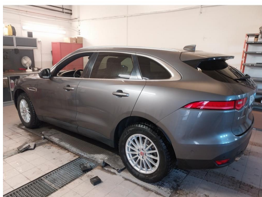
2.1 Div steinsprut noe mer korrosjon og lakkriper finnes.