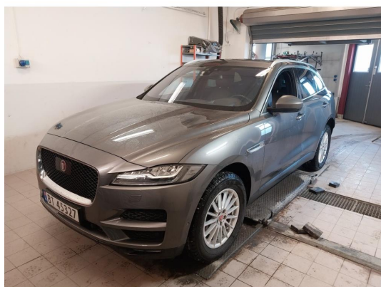
2.1 Div steinsprut noe mer korrosjon og lakkriper finnes.