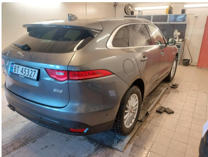
2.1 Div steinsprut noe mer korrosjon og lakkriper finnes.