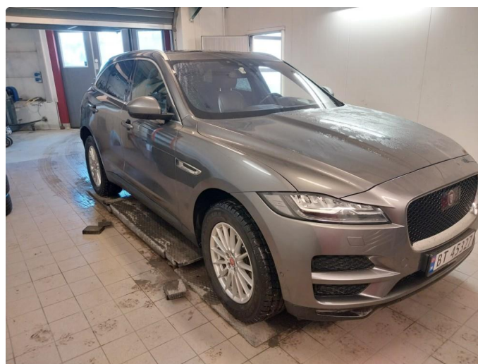
2.1 Div steinsprut noe mer korrosjon og lakkriper finnes.