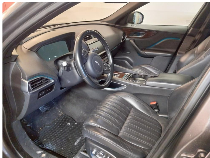
2.1 Div steinsprut noe mer korrosjon og lakkriper finnes.