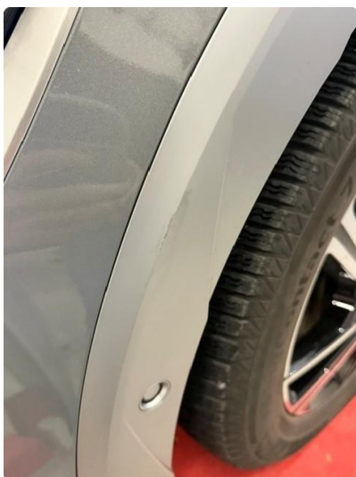
1.3 Skjermtutbygger skadet