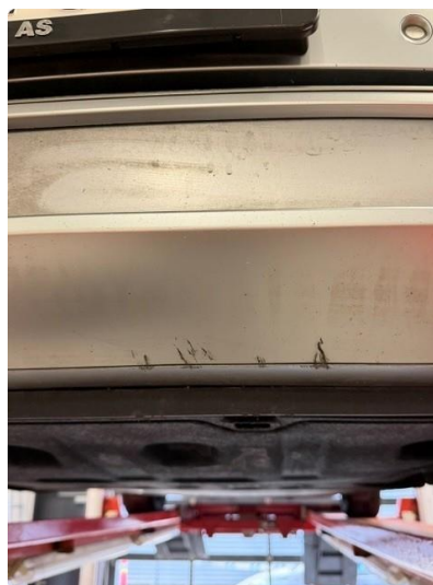
1.4 Ripe(r) ned til grunning