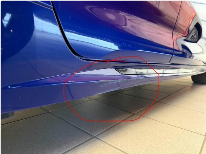
1.1 Ripe. Fikses før salg