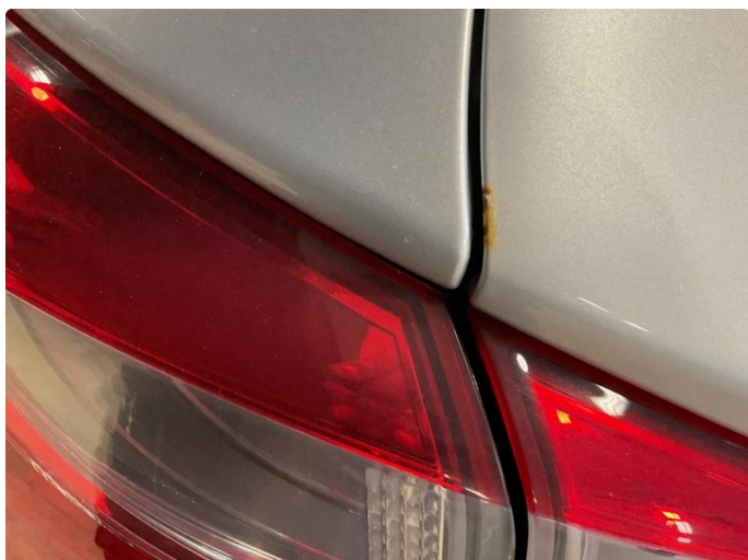
1.1 Rust i fals