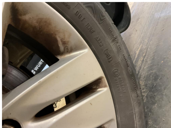
1.2 Dekkskade sommerhjul