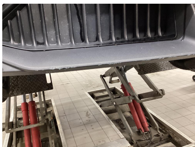
1.3 Bruks merker