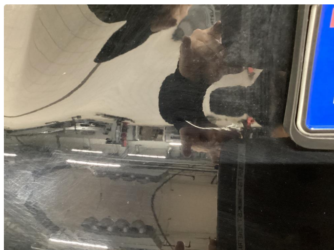
1.2 Bruks merker