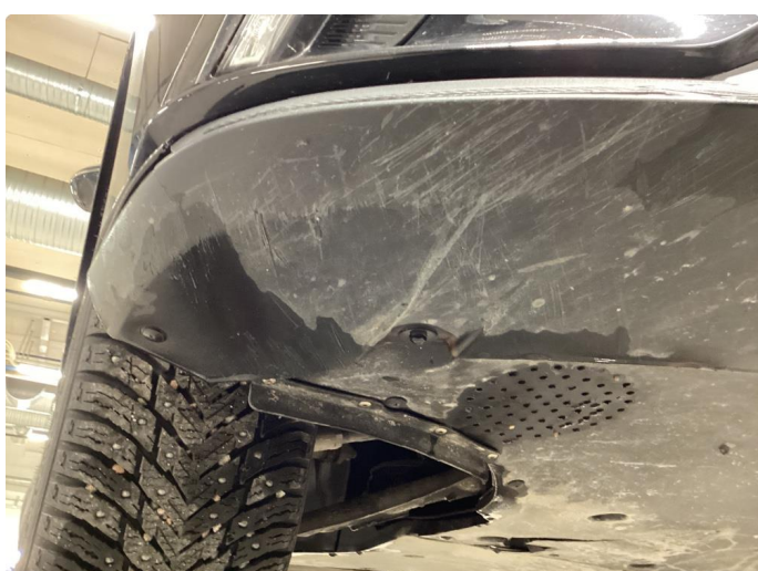
1.3 Bruks merker