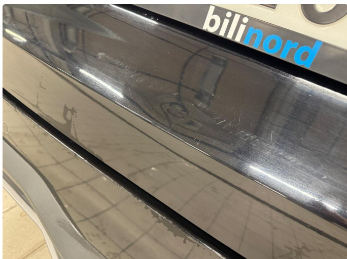
1.1 Bruks merker