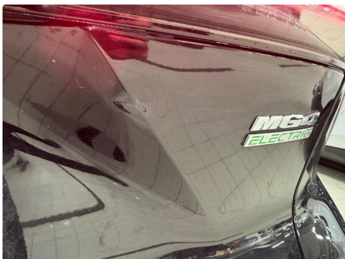
1.1 Bruks merker