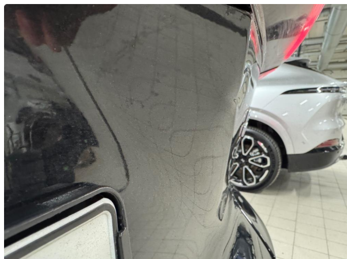
1.1 Bruks merker