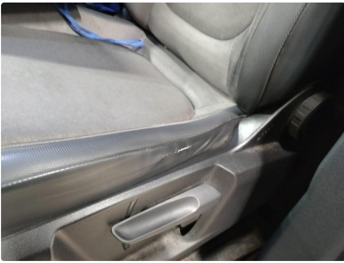
2.1 Skade på setepute