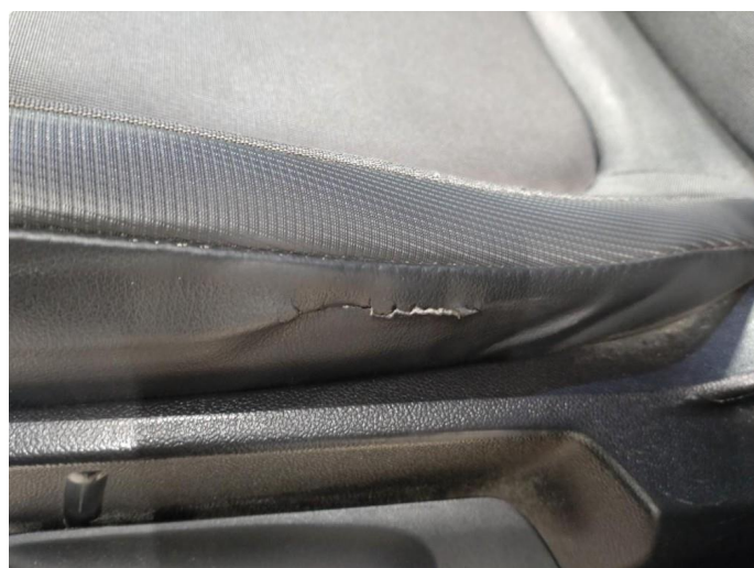
2.1 Skade på setepute