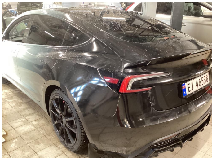
1.1 Bil er helfoliert