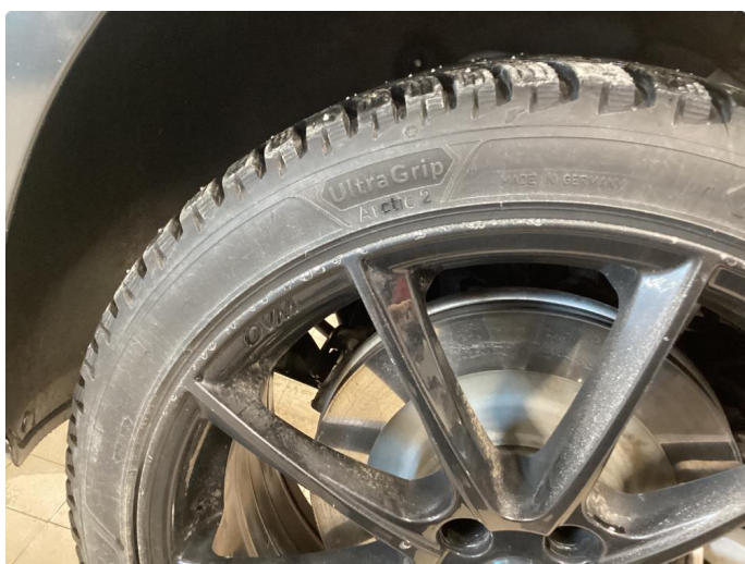
1.2 Noen merker på felger