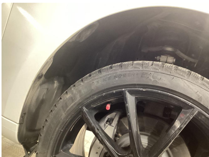
1.2 Noen merker på felger