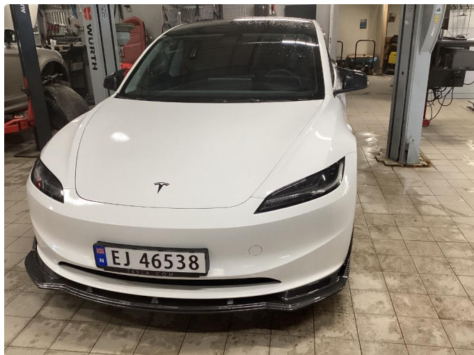
1.1 Bil er helfoliert