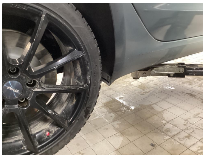
1.2 Noen merker på felger