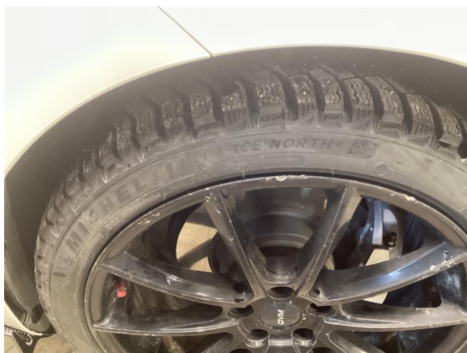
1.2 Noen merker på felger