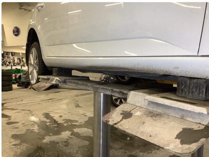
1.7 Bulk med lakkskade