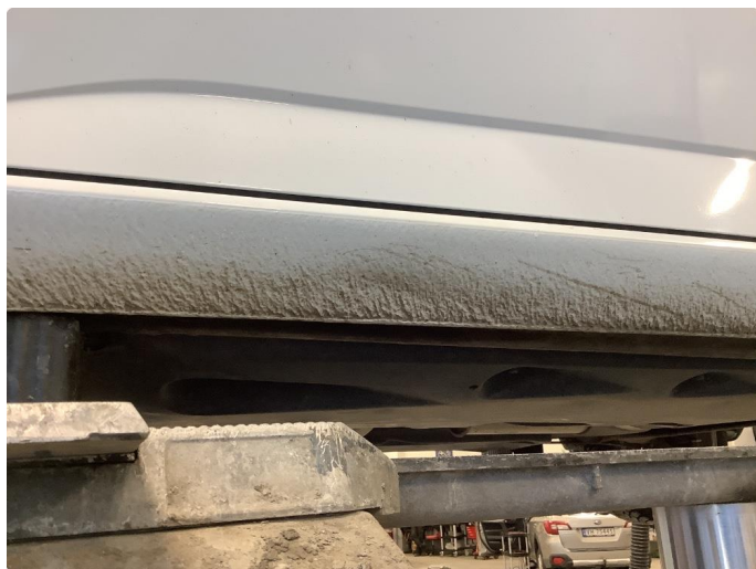
1.8 Bulk med lakkskade