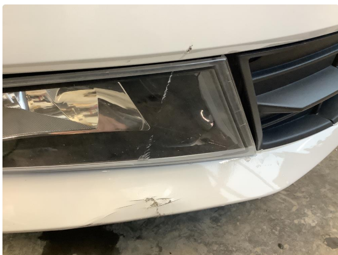
2.1 Tåkelys - defekt / sprukket glass