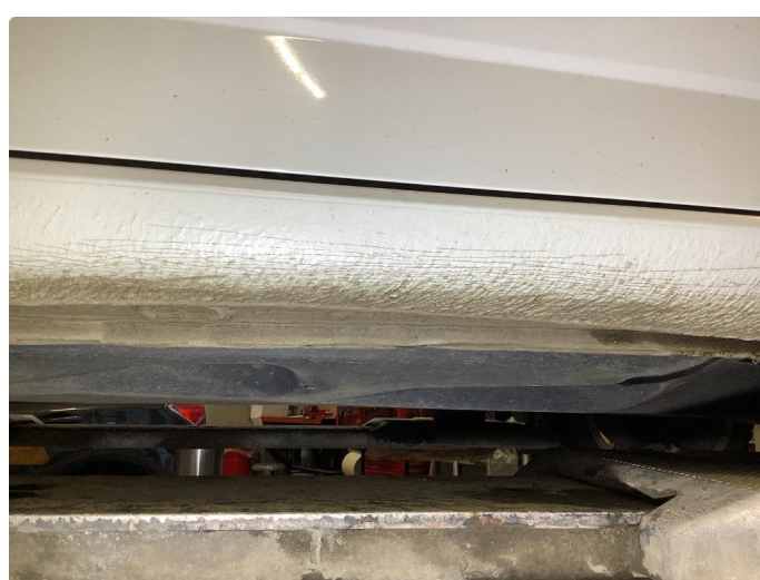
1.7 Bulk med lakkskade