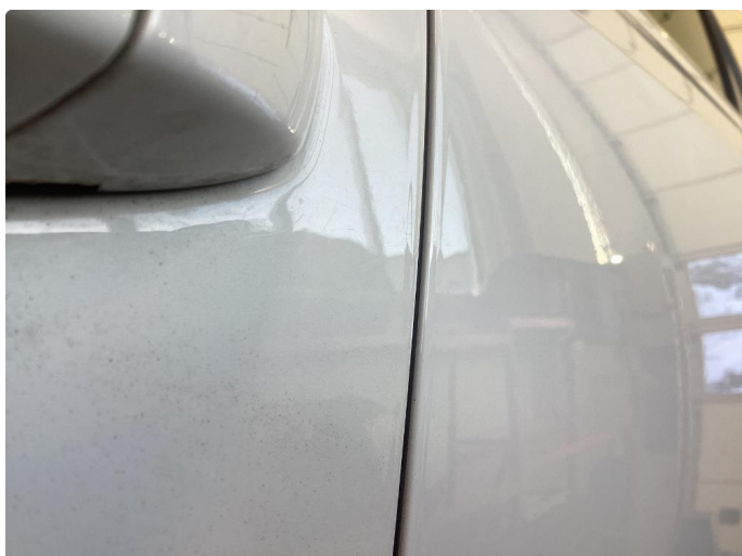
1.1 Delvis omlakkert