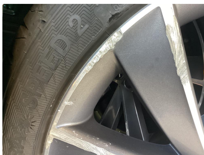
1.3 2 kantkjørte sommerfelger felg