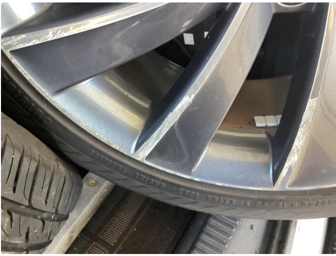
1.3 2 kantkjörte sommerfelger felg