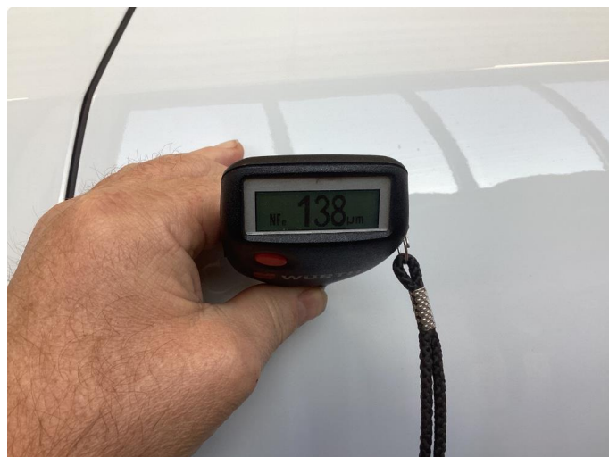
1.1 Delvis omlakkert