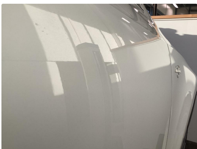
1.2 P-bulk høyre fordør