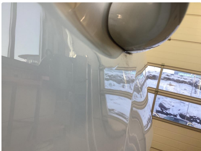
1.1 Delvis omlakkert