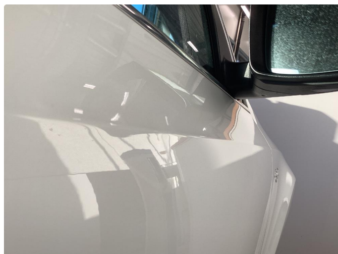
1.2 P-bulk høyre fordør