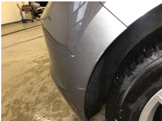
1.1 Noen riper på bakfanger høyre side, disse blir utbedret