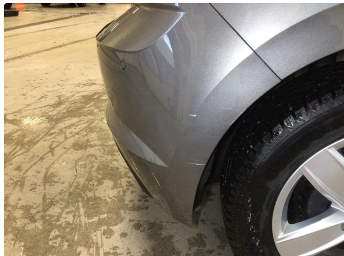
1.1 Noen riper på bakfanger høyre side, disse blir utbedret