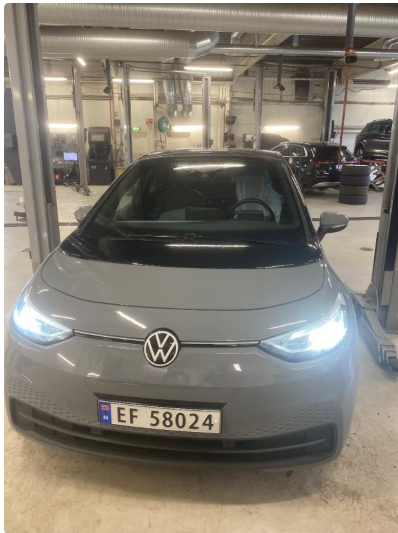
1.1 Øvrige feil