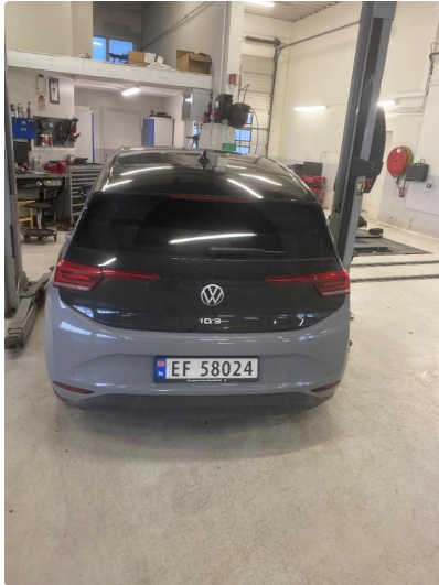
1.1 Øvrige feil