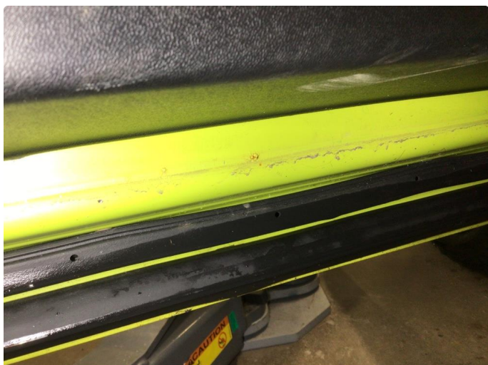
1.1 Noe korrosjon under dørbekledning på venstre framdør og høyre bakdør, dette av ubetydelig karakter