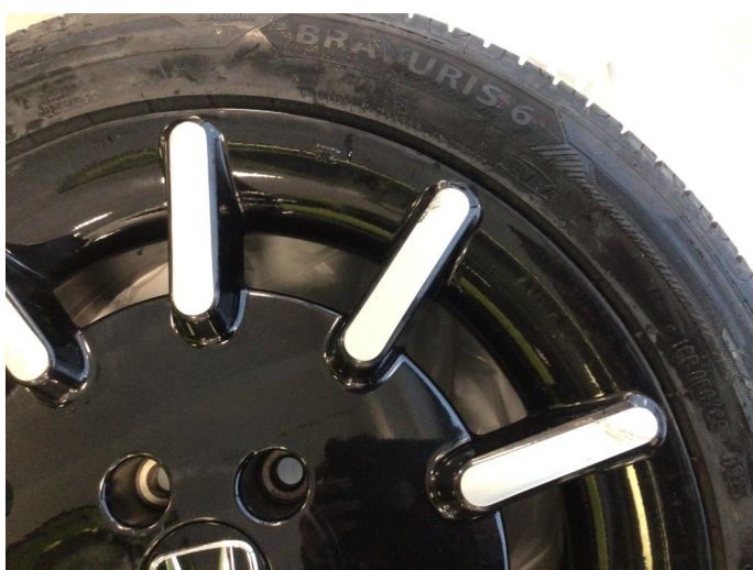
1.3 Kantkjørt to sommerfelger