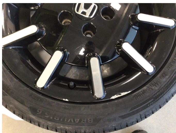
1.3 Kantkjørt to sommerfelger