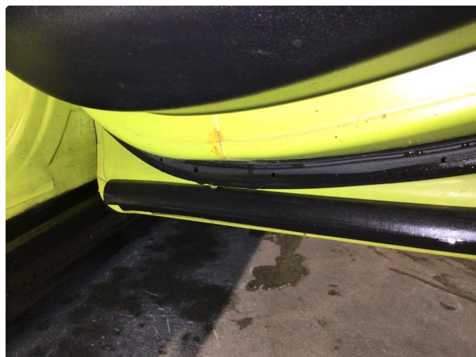
1.1 Noe korrosjon under dørbekledning på venstre framdør og høyre bakdør, dette av ubetydelig karakter