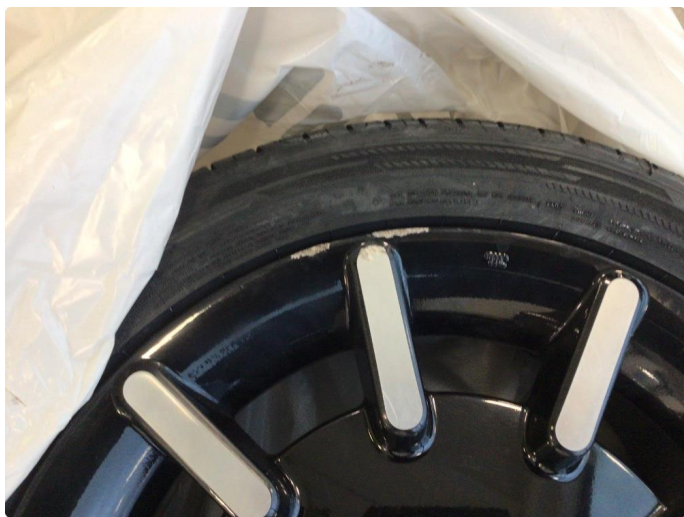
1.3 Kantkjørt to sommerfelger