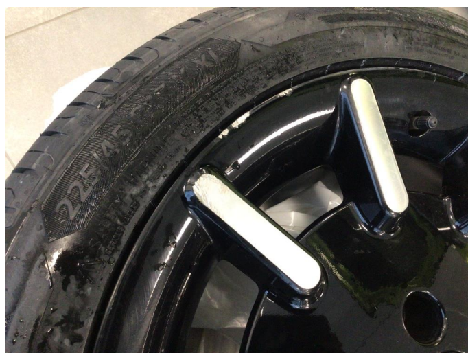
1.3 Kantkjørt to sommerfelger