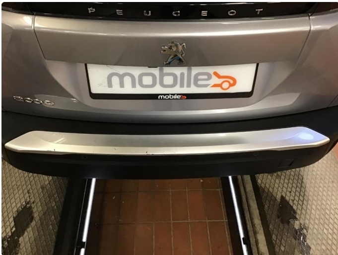
1.1 Noe riper på bakfanger