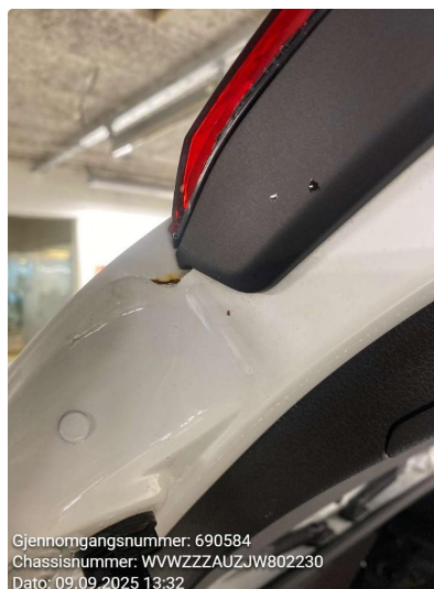
1.2 Rust/korrosjon, flekkes