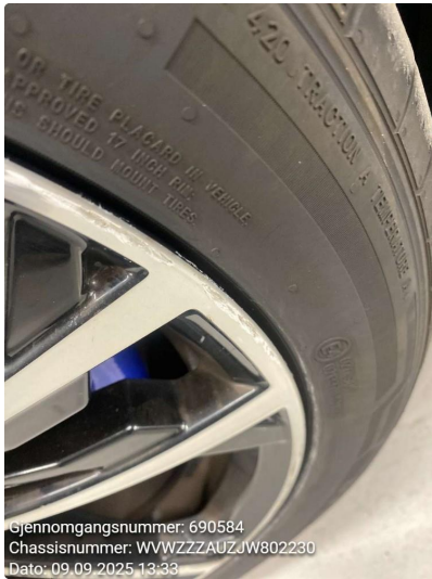
1.5 Kantkjørt felg