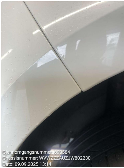
1.4 Rust, Flekkes