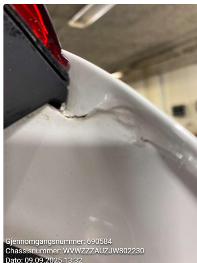
1.2 Rust/korrosjon, flekkes