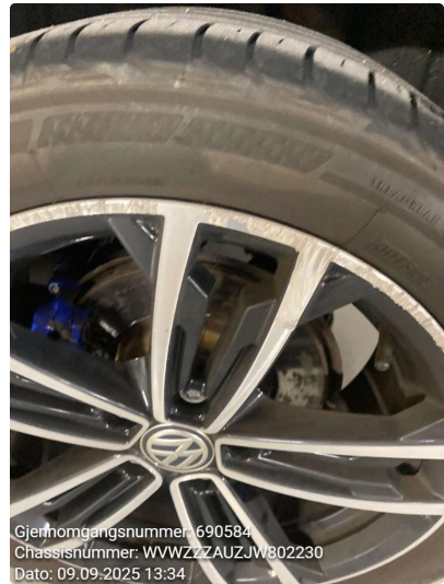
1.5 Kantkjørt felg