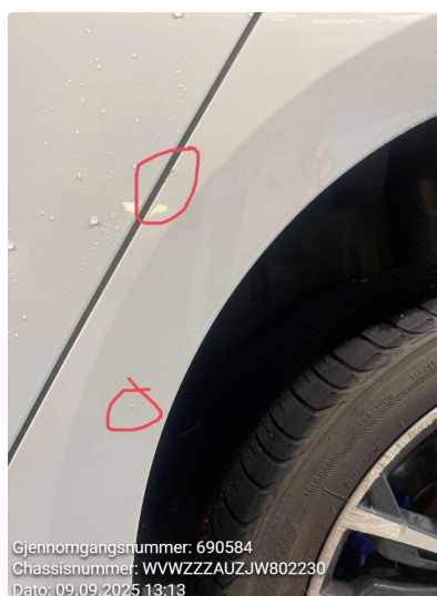
1.3 Rust, Flekkes