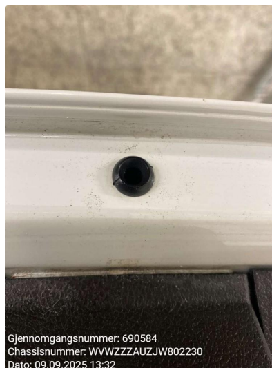
1.2 Rust/korrosjon, flekkes