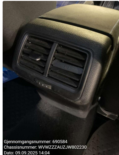
2.1 Skadet luftventil