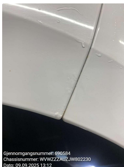
1.3 Rust, Flekkes