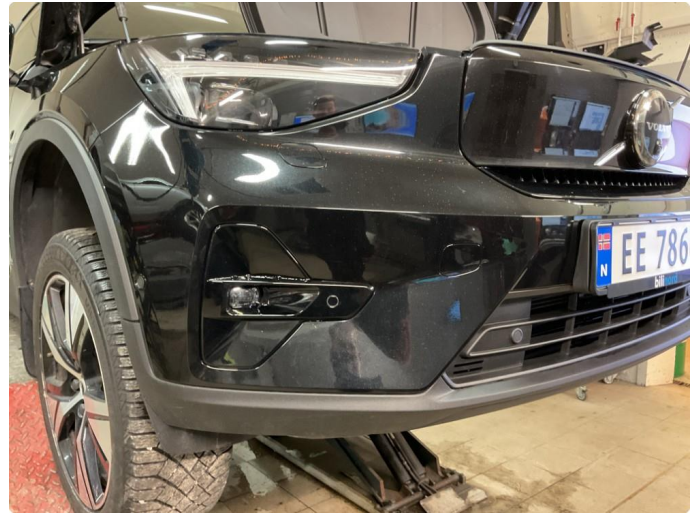
1.1 Noen små steinsprang i støtfanger foran. Normal slitasje