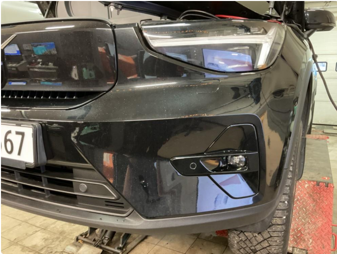
1.1 Noen små steinsprang i støtfanger foran. Normal slitasje